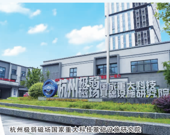
杭州极弱磁场国家重大科技基础设施研究院