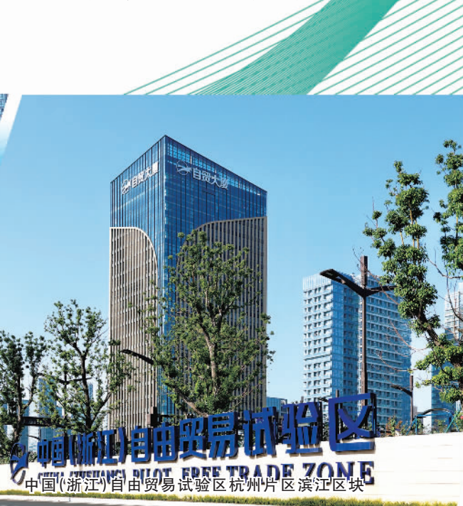
中国(浙江)自由贸易试验区杭州片区滨江区块