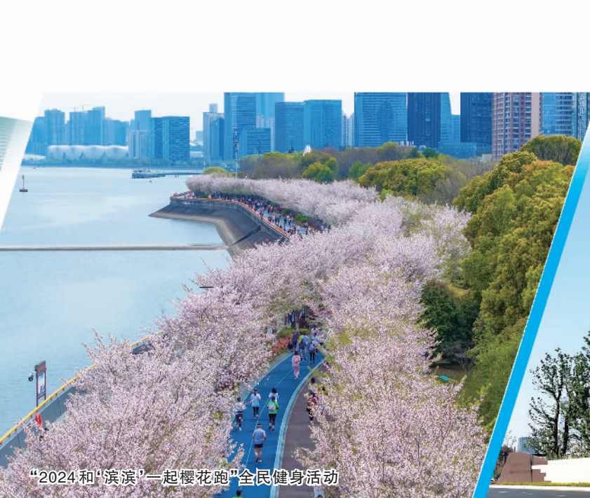
“2024和‘滨滨’一起樱花跑”全民健身活动