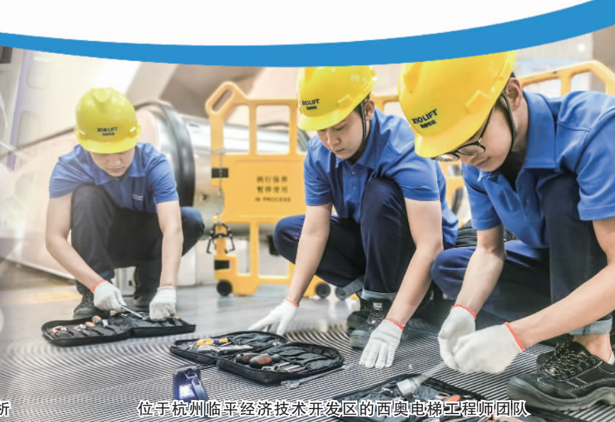
位于杭州临平经济技术开发区的西奥电梯工程师团队