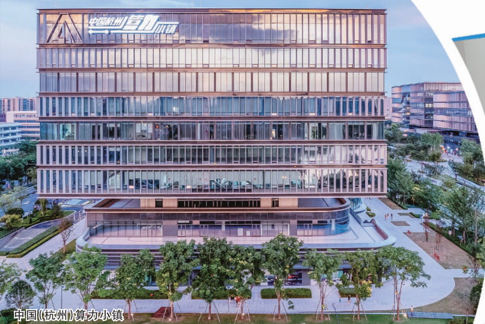
中国(杭州)算力小镇