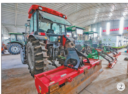
图①：无人机对两村稻田进行飞防作业。 图②：万州区综合农事服务与应急中心停放的农机。