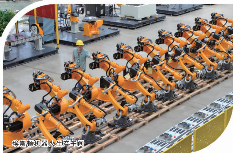
埃斯顿机器人生产车间

此外，江宁开发区企业南京国电南自自动化有限公司报送的“江苏南京电力自动化制造企业工业生产绿色智慧用能实践”成功入选国家能源局能源绿色低碳转型典型案例，项目内容包括厂区光伏电站及智能微电网、能源管理平台建设、绿色供应链管理和绿色运营等。