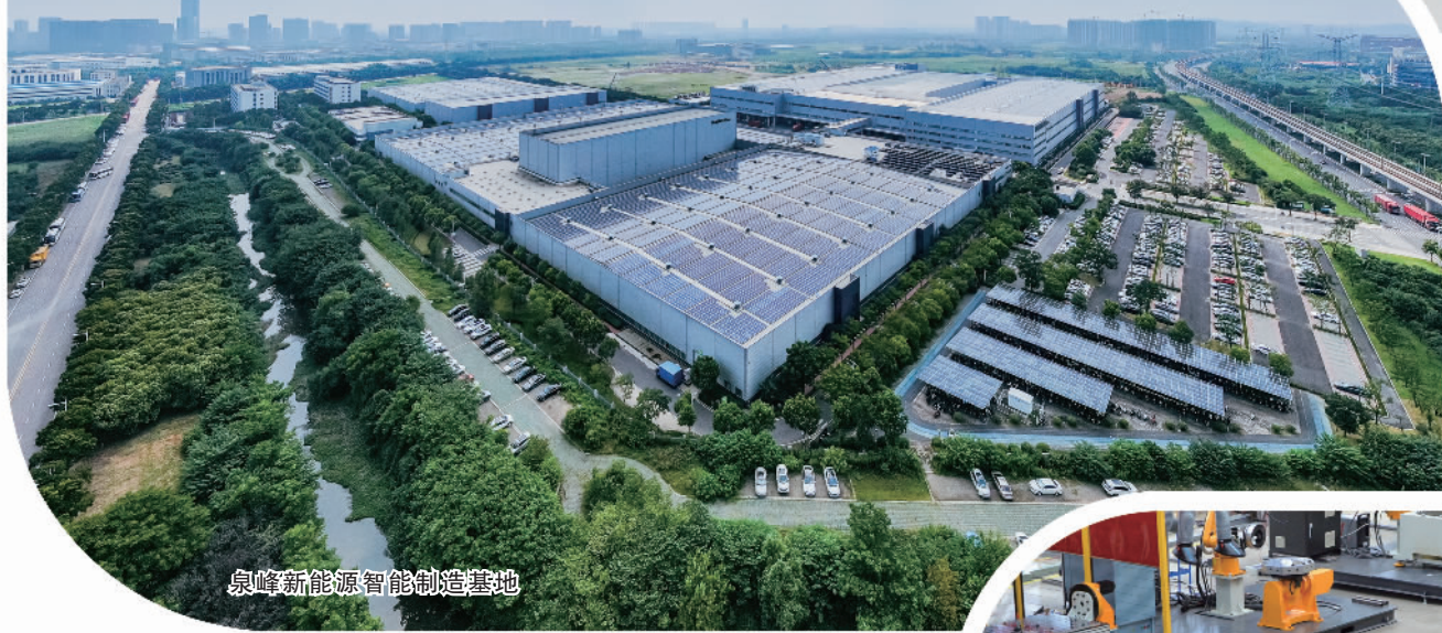
泉峰新能源智能制造基地

招商引资作为拉动经济、集聚产业的重要方式，直接关系到区域经济发展的速度和质量。江宁开发区持续发力攻坚克难，聚焦智能电网、