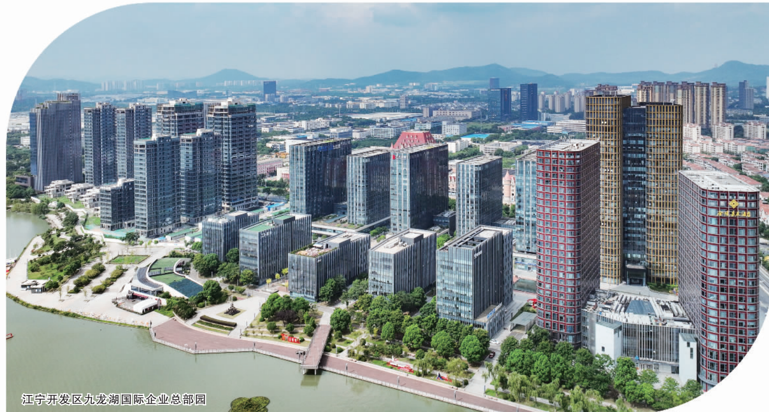
江宁开发区九龙湖国际企业总部园