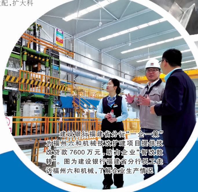
建设银行福建省分行“一企一策”为福州六和机械技改扩建项目提供技改贷款7600万元，助力企业“智改数转”。图为建设银行福建省分行员工走访福州六和机械，了解企业生产情况