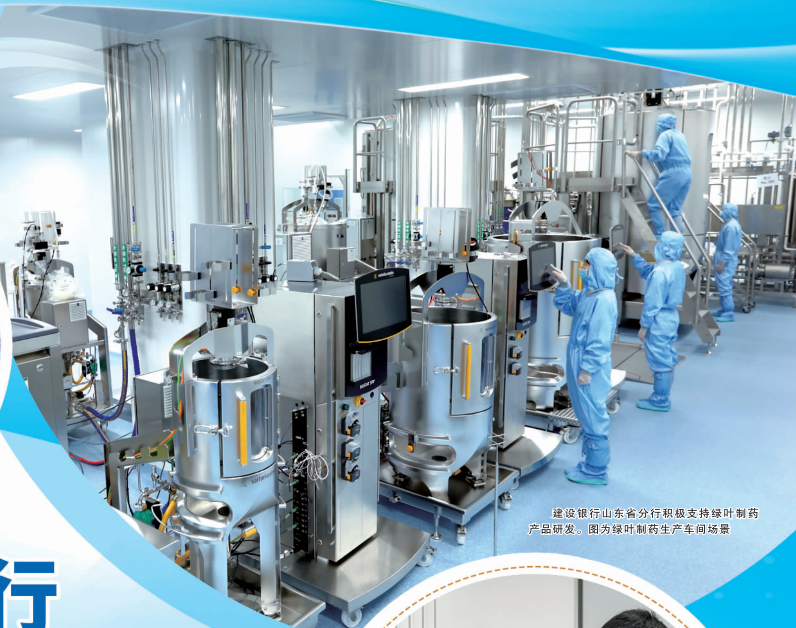
建设银行山东省分行积极支持绿叶制药产品研发。图为绿叶制药生产车间场景