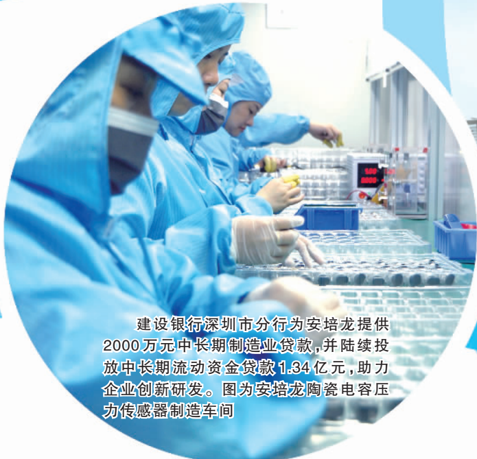
建设银行深圳市分行为安培龙提供2000万元中长期制造业贷款，并陆续投放中长期流动资金贷款1.34亿元，助力企业创新研发。图为安培龙陶瓷电容压力传感器制造车间