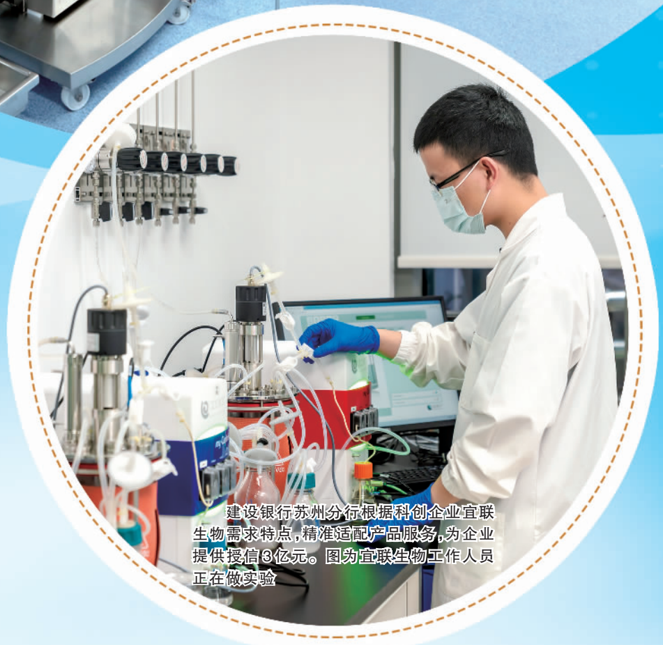
建设银行苏州分行根据科创企业互联生物需求特点，精准适配产品服务，为企业提供授信8亿元。图为互联生物工作人员正在做实验

近年来，中国建设银行积极践行国有大行的责任担当，提升科技金融服务质效，共促“科技—产业—金融”良性循环，助力科技创新引领现代化产业体系建设，为加快发展新质生产力，实现高水平科技自立自强贡献建行力量。