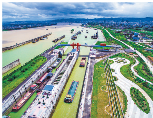
图为长洲枢纽船闸往来船舶繁忙。

下一步,珠航局将持续突出重点、多维发力,加快推动西江航运干线保通保畅能力和水平提升,进一步凸显水运大通道整体效能及优势,引导“公转水”等运输结构优化调整。