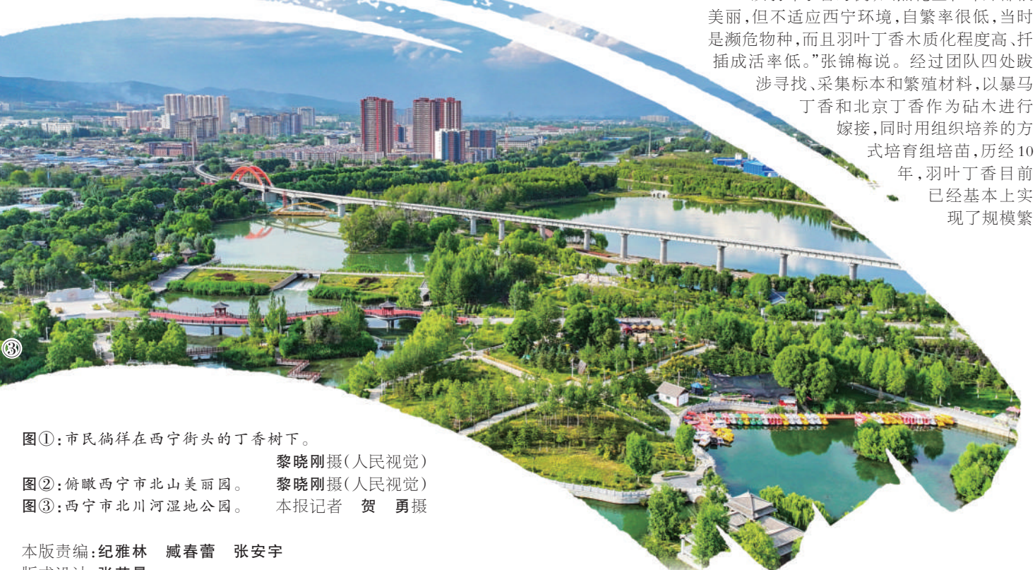
图①:市民徜徉在西宁街头的丁香树下。 黎晓刚摄(人民视觉) 图②:俯瞰西宁市北山美丽园。 黎晓刚摄(人民视觉) 图③:西宁市北川河湿地公园。 本报记者 贺勇摄

当年的壮小伙也变成了老老汉,但不改的,是身上那股倔劲。“人在绿化大山,大山也在回应着人啊!”登上一处高地,高耸翠绿的青山近在眼前,摸着去年刚种的云杉,李玉斌古铜色的脸上难掩自豪,“这背后,可不是简单的数量增加,你看脚下土地,腐殖层越来越厚,土壤的肥力和保墒能力都在改善,还有成千上万个保水保土的水平阶