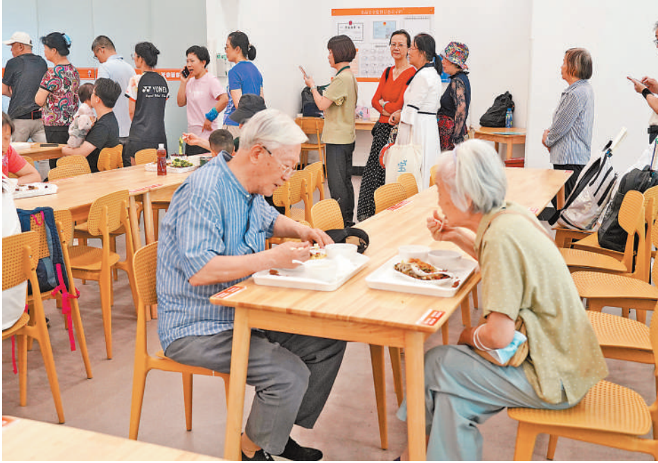
老年人在广东深圳市福田区梅林街道梅林一村社区食堂就餐。

江苏苏州市姑苏区是人口繁盛的老城区,60岁以上人口占比超过30%。目前,姑苏区绝大部分社区老年食堂都由姑苏健康养老产业发展有限公司运营,开设了13家综合老服务中心,每家中心都配有售餐窗口、用餐区、厨房等场地设施,并向社会开放,同时还为15家日间照料点提供配餐服务,平均每个综合老服务中心每天提供超2000人次的老年助餐服务。