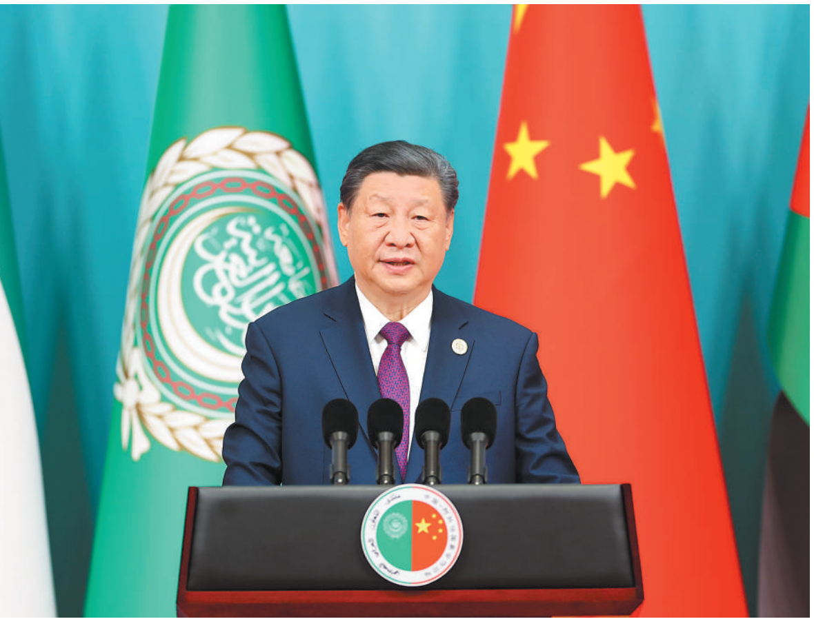
5月30日上午,国家主席习近平在北京钓鱼台国宾馆出席中阿合作论坛第十届部长级会议开幕式并发表主旨讲话。