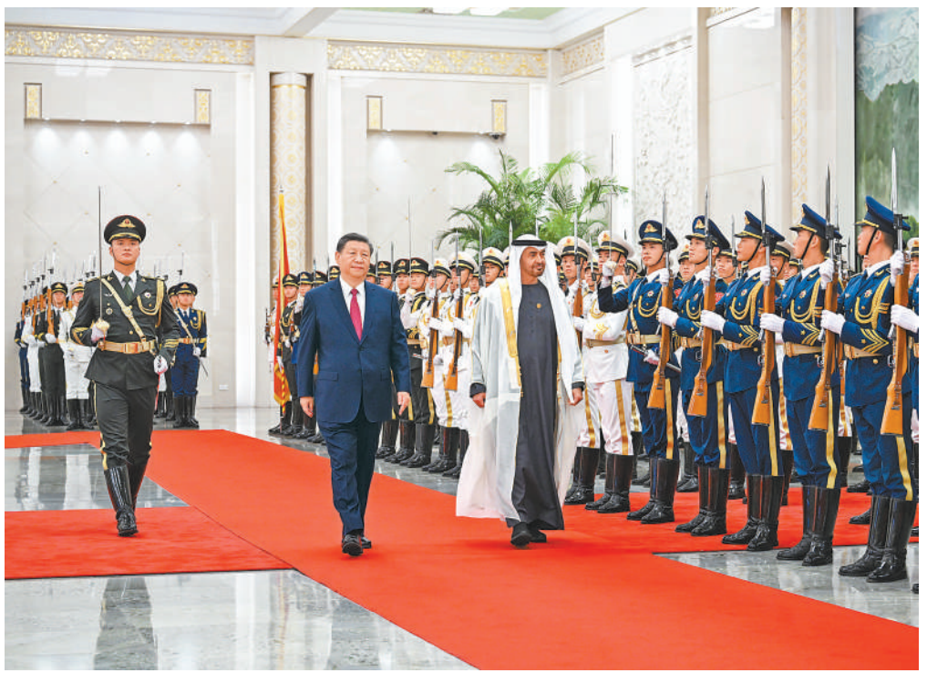
5月30日下午,国家主席习近平在北京人民大会堂同来华国事访问并出席中国—阿拉伯国家合作论坛第十届部长级会议开幕式的阿联酋总统穆罕默德举行会谈。这是会谈前,习近平在人民大会堂北大厅为穆罕默德举行欢迎仪式。

新华社北京5月30日电 (记者孙奕、王宾)5月30日下午,国家主席习近平在北京人民大会堂同来华国事访问并出席中国—阿拉伯国家合作论坛第十届部长级会议开幕式的阿联酋总统穆罕默德举行会谈。 习近平指出,阿联酋是中国重要的全面战略伙伴。近年来,在我们共同引领下,中阿关系保持良好发展势头,树立了新时期中国和阿拉伯国家关系的典范。今年是中阿两国建交40周年,是中阿关系承上启下、继往开来的重要节点。中方愿同阿方一道,继续从战略高度和长远角度牢牢把握两国关系大方向,确保中阿全面战略伙伴关系始终蓬勃发展。 习近平强调,中方支持阿联酋走独立自主的发展道路,支持阿方维护国家主权、安全、发展利益,愿同阿方巩固政治互信,加强合作,携手构建中阿命运共同体。中方愿同阿方持续推进高质量共建“一带一路”,加强发展战略对接,以建立中阿投资合作高级别委员会为契机,推动两国合作取得更多成果。巩固贸易、能源、基础设施等领域合作,拓展信息技术、人工智能、数字经济、新能源等高新技术领域合作。加强执法安全合作。前不久,我专门给阿联酋中文学习者回信,勉励他们学好中文、了解中国,为促进中阿友好作出贡献。中方愿继续支持“百校教中文”项目,推进阿联酋中国文化中心建设,加强人文交流,增进彼此了解和友谊。 习近平指出,当前,世界多极化趋势不可阻挡。多极化本质上应该是不同文明、不同制度、不同道路之间相互尊重、和平共处。中东地区国家是发展中国家的重要组成部分,是世界多极化的重要力量。中方支持地区国家继续走符合本国国情的发展道路,坚定走团结自强、和平和解之路,坚持通过沟通协商化解分歧,把前途命运掌握在自己手中。中方愿同阿联酋等阿拉伯国家一道努力,办好第二届中国—阿拉伯国家峰会,推进中国和阿拉伯国家命运共同体建设。中方愿同阿方加强中海战略伙伴关系,拓展多边合作,维护“全球南方”国家共同利益。 穆罕默德表示,很高兴再次访问我的第二故乡中国并同习近平主席共同出席中国—阿拉伯国家合作论坛第十届部长级会议开幕式。 (下转第二版)