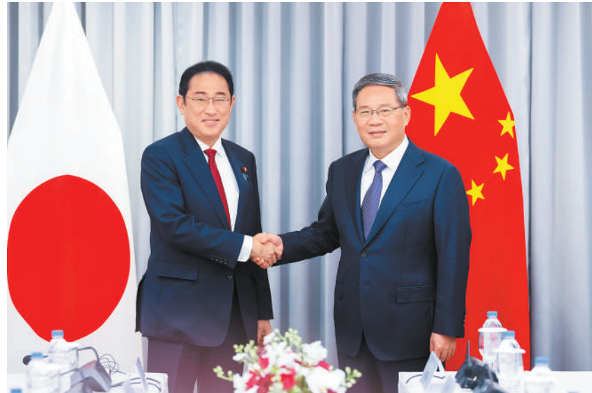
当地时间5月26日晚，国务院总理李强在首尔出席第九次中日韩领导人会议期间会见日本首相岸田文雄。