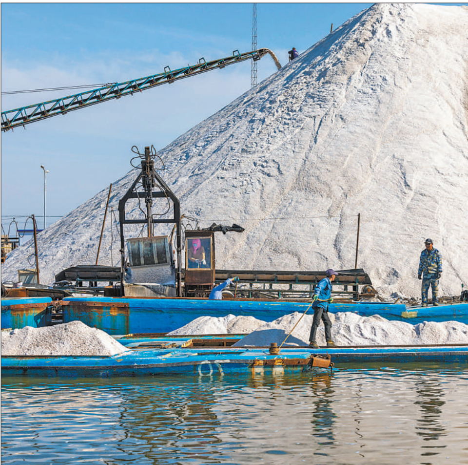
5月22日，河北唐山，盐场工人将收获的春盐装船。时下正值春盐收获的季节，工人们利用晴好天气抢收春盐，盐滩一片繁忙景象。

图为创新中心整车无线通信实验室内，车辆在进行实验。