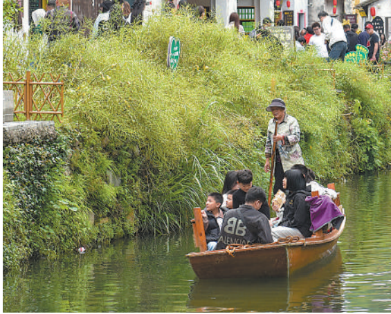
图①:浙江省玉环市干江镇滨海旅游带,游客体验高空骑车等户外项目。 图②:重庆市北碚区推出乡村旅游系列研学产品,吸引众多学生前来体验农事活动。 图③:广西壮族自治区柳州市融安县泗顶镇,小朋友在参加捉鱼比赛。 图④:江西省婺源县秋口镇李坑古村如画风景吸引众多游客。