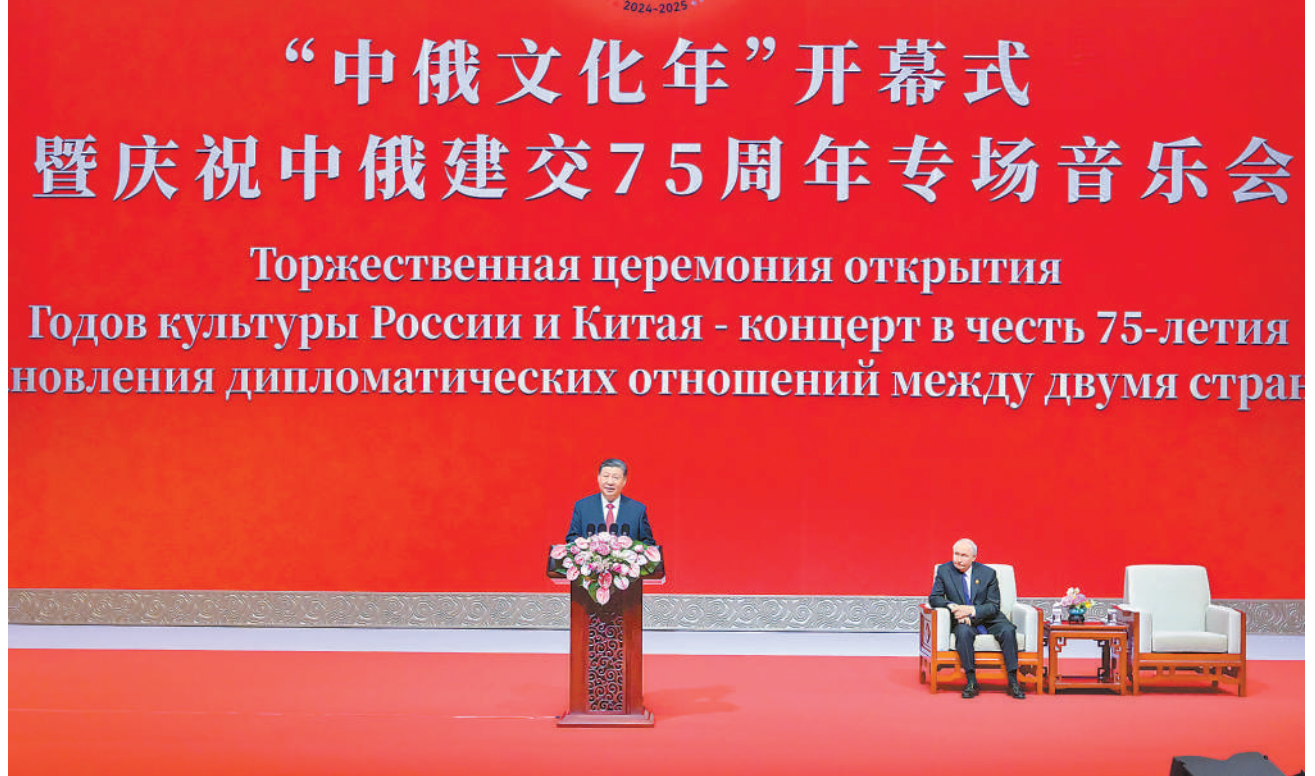
5月16日下午,国家主席习近平和俄罗斯总统普京在北京国家大剧院共同出席“中俄文化年”开幕式暨庆祝中俄建交75周年专场音乐会并致辞。

新华社北京5月16日电 (记者孙奕)5月16日下午,国家主席习近平和俄罗斯总统普京在北京国家大剧院共同出席“中俄文化年”开幕式暨庆祝中俄建交75周年专场音乐会并致辞。习近平和普京在热烈的掌声中一同步入会场。