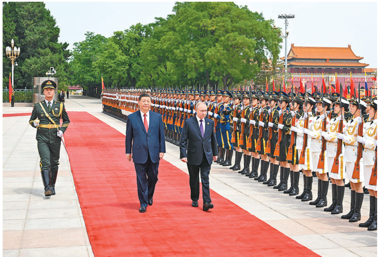
5月16日上午,国家主席习近平在北京人民大会堂同来华进行国事访问的俄罗斯总统普京举行会谈。这是会谈前,习近平在人民大会堂东门外广场为普京举行隆重欢迎仪式。