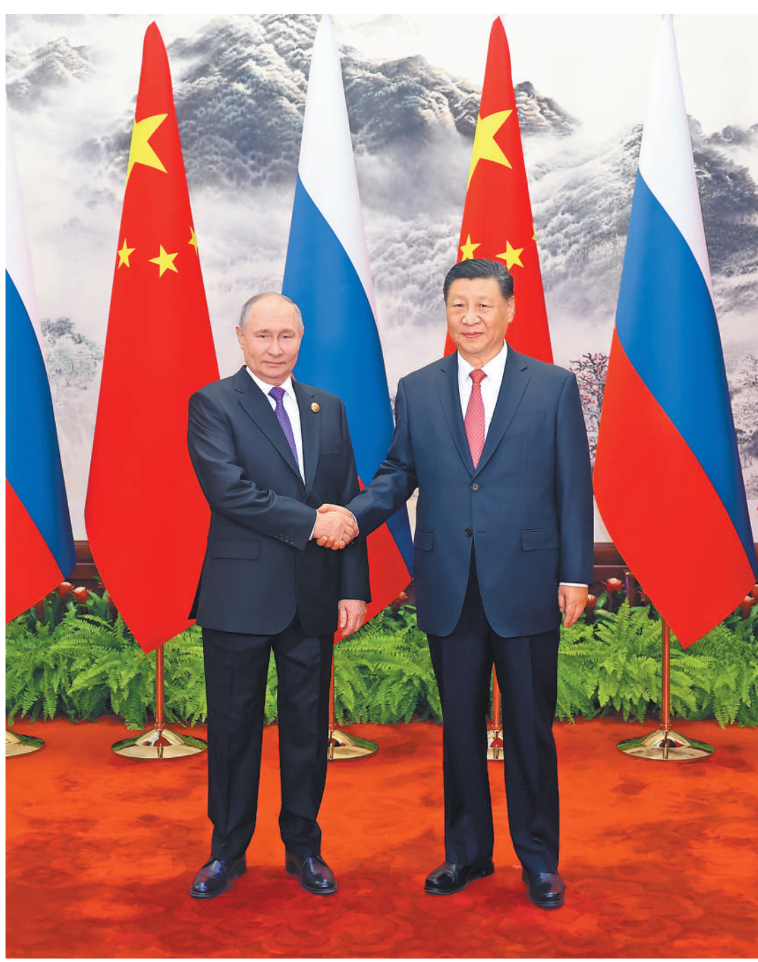
5月16日上午,国家主席习近平在北京人民大会堂同来华进行国事访问的俄罗斯总统普京举行会谈。这是习近平同普京握手。