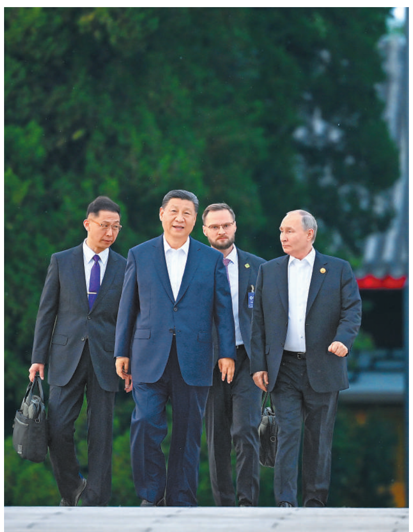
5月16日晚,国家主席习近平在北京中南海同俄罗斯总统普京举行小范围会晤。

普京介绍了俄方有关看法和立场,表示俄方赞赏中方在乌克兰问题上秉持客观、公正、平衡立场,欢迎中方为政治解决乌克兰问题继续发挥重要建设性作用。(下转第四版)