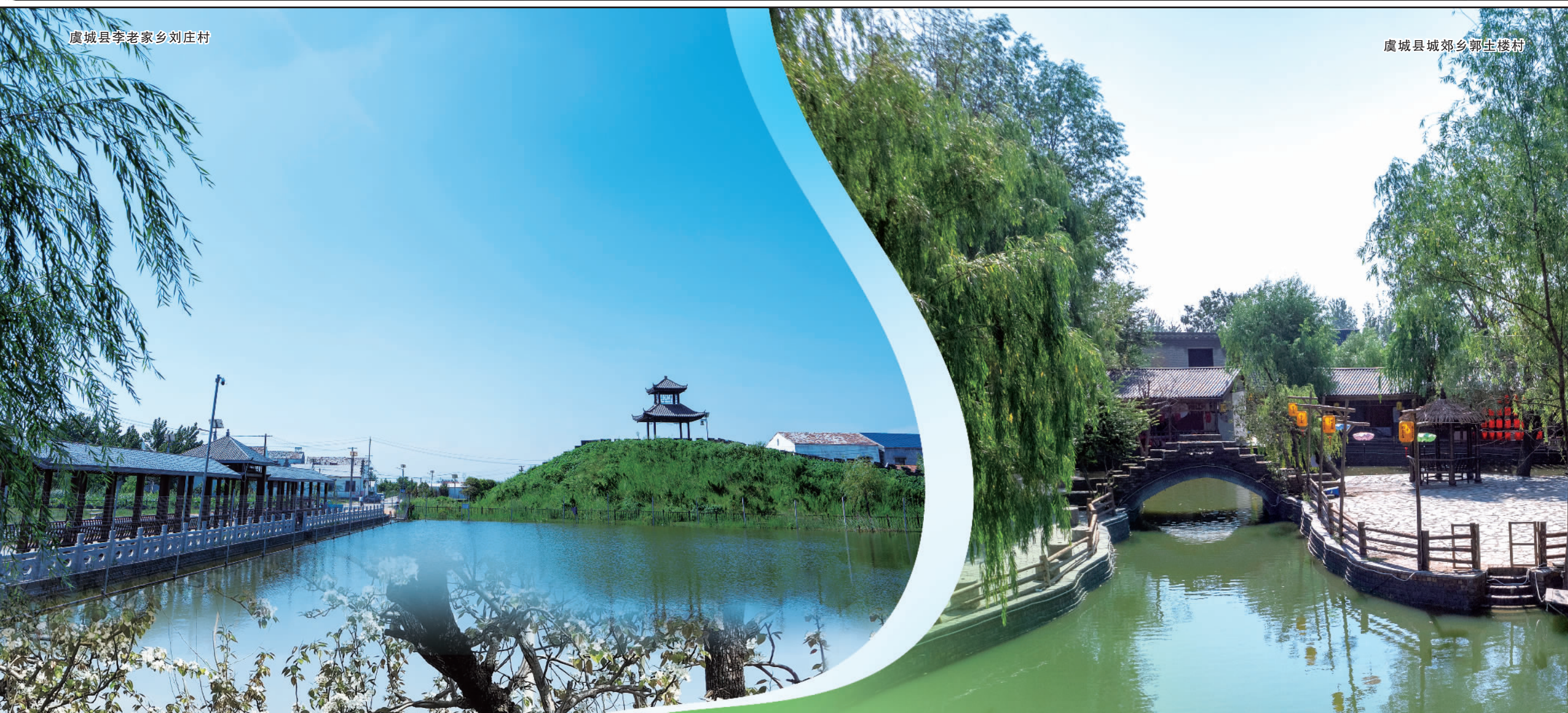
虞城县城郊乡郭土楼村