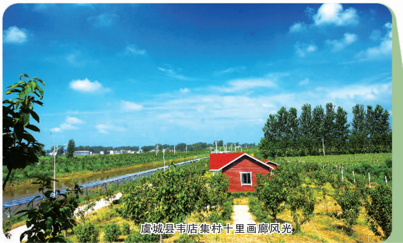
虞城县韦店集村十里画廊风光