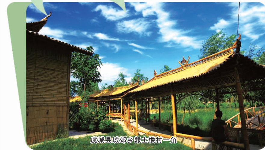
虞城县城郊乡郭土楼村一角