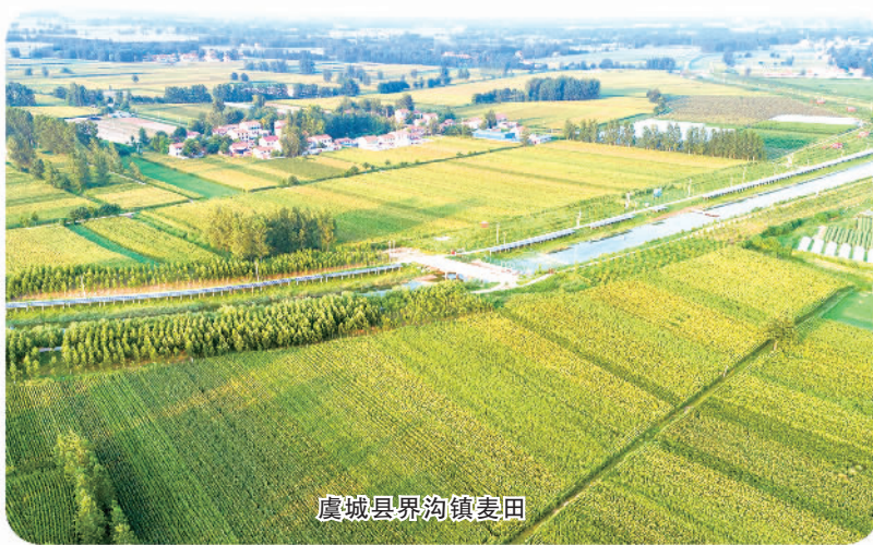
虞城县界沟镇麦田