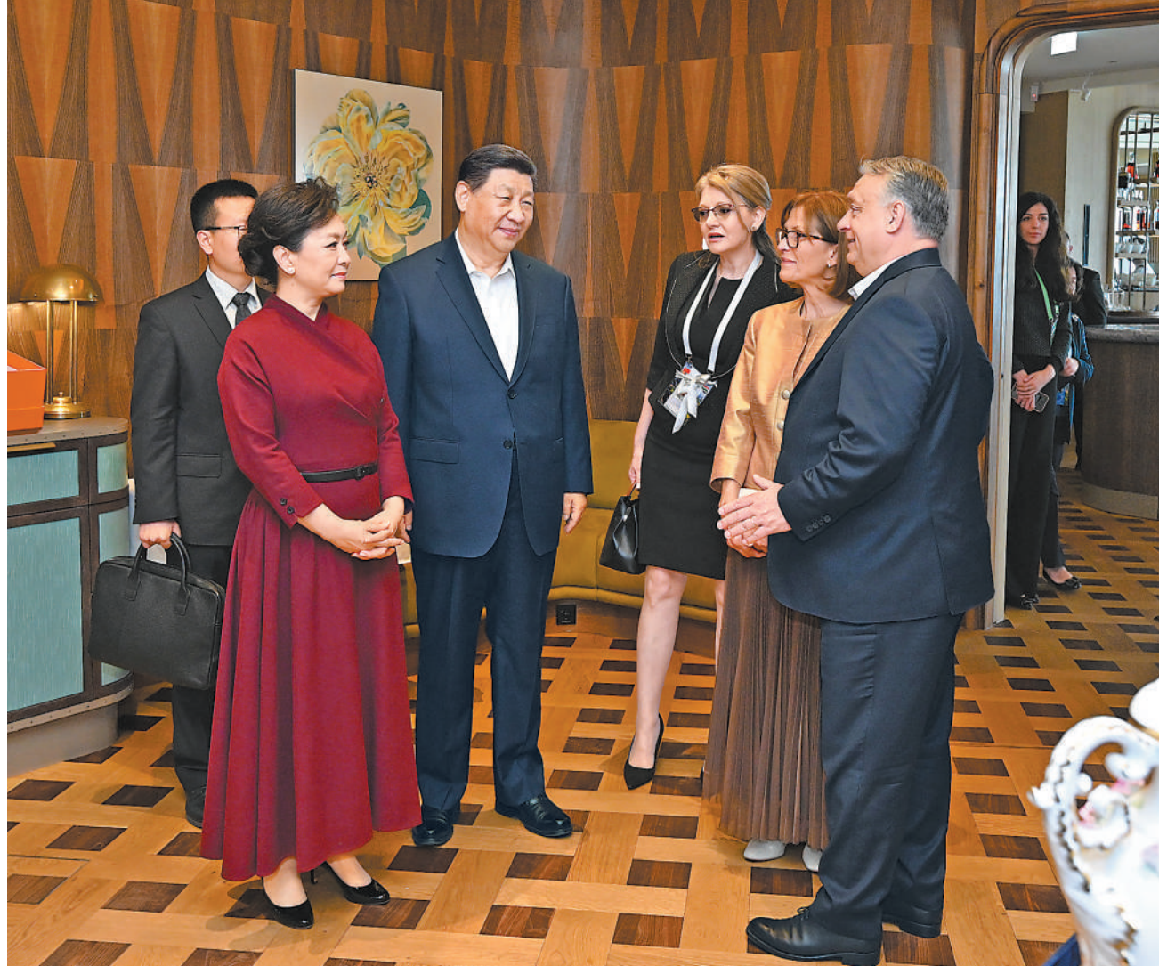
当地时间5月10日中午，国家主席习近平和夫人彭丽媛在布达佩斯应邀出席匈牙利总理欧尔班和夫人举行的饯行活动。

本报布达佩斯5月10日电（记者王洲、王翔宇）当地时间5月10日中午，国家主席习近平和夫人彭丽媛在布达佩斯应邀出席匈牙利总理欧尔班和夫人举行的饯行活动。 两国领导人夫妇一同眺望布达佩斯市景，多瑙河两岸的秀丽风光尽收眼底。欧尔班向习近平介绍布达佩斯城市历史、发展变化和规划前景，表示中国企业为匈牙利经济发展和城市建设作出了重要贡献，很多中方承建项目成为两国合作的旗帜项目和友谊象征。中国技术在很多方面居于世界领先地位，匈方期待同中方开展更多合作，引进更多中国先进技术，助力匈牙利国家发展和民生改善。 习近平感谢欧尔班的热情邀请和精心安排。习近平表示，我在这里既感受