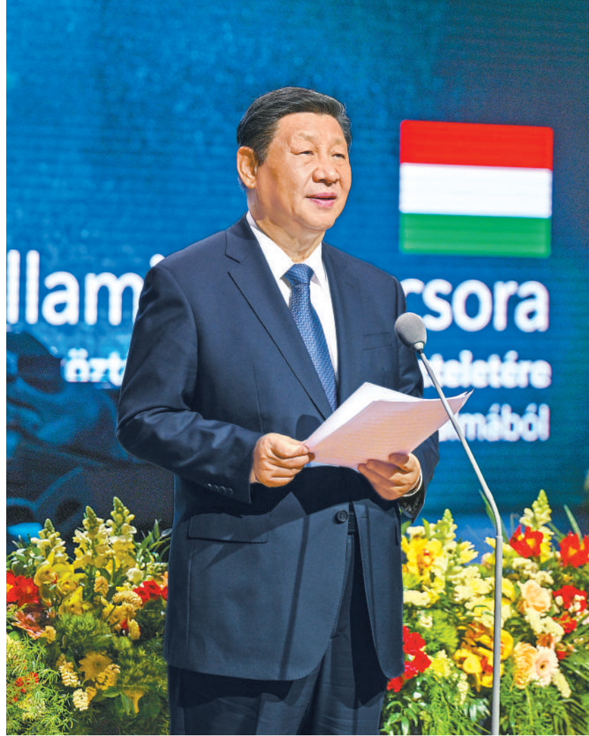
当地时间五月九日晚，国家主席习近平和夫人彭丽媛在布达佩斯城堡山出席匈牙利总理欧尔班和夫人雷沃伊举行的隆重欢迎宴会。这是习近平在宴会上致辞。

实现新的更大发展。 我们一致认为，中匈两国对国际和地区形势的看法相似、立场相近，愿在多边领域加强沟通和协作，积极倡导平等有序的世界多极化和普惠包容的经济全球化，坚定捍卫国际公平正义，推动构建人类命运共同体。 习近平强调，当前，中国正以中国式现代化全面推进强国建设、民族复兴伟业。中国式现代化将给世界带来巨大机遇。中方愿同匈方实现共同发展、共同繁荣。我相信，在双方共同努力下，中匈两国的明天一定会更加美好！ 欧尔班表示，热烈欢迎习近平主席在匈中建交75周年之际对匈牙利进行国事访问。匈中友谊深厚，关系稳固。匈方恪守一个中国原则，双方相互尊重、相互支持，互利合作造福了人民。感谢中国在匈困难之际提供宝贵援助。中国是世界多极化格局中的重要和积极力量。匈方支持习近平主席提出的系列全球倡议，赞同中方为推动和平解决乌克兰危机等地区冲突提出的方案。匈方希望进一步提升匈中关系，在各自实现现代化的进程中做坚定合作的伙伴。 蔡奇、王毅等出席活动。