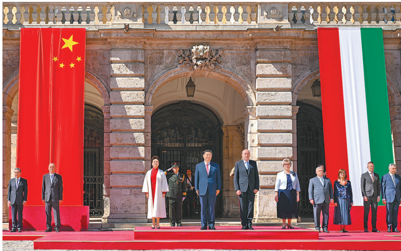
当地时间5月9日上午,国家主席习近平在布达佩斯出席匈牙利总统舒尤克和总理欧尔班共同举行的隆重欢迎仪式。