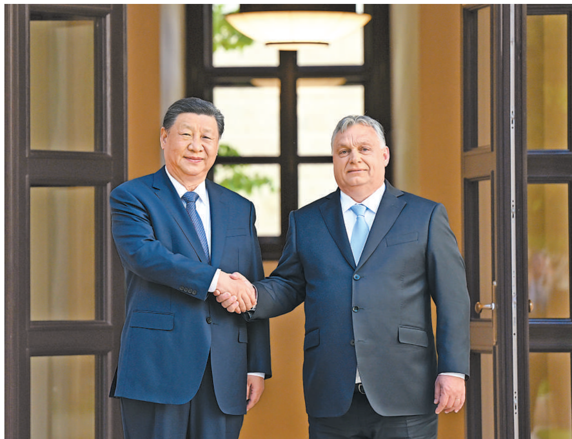
当地时间五月九日下午,国家主席习近平在布达佩斯总理府同匈牙利总理欧尔班举行会谈。