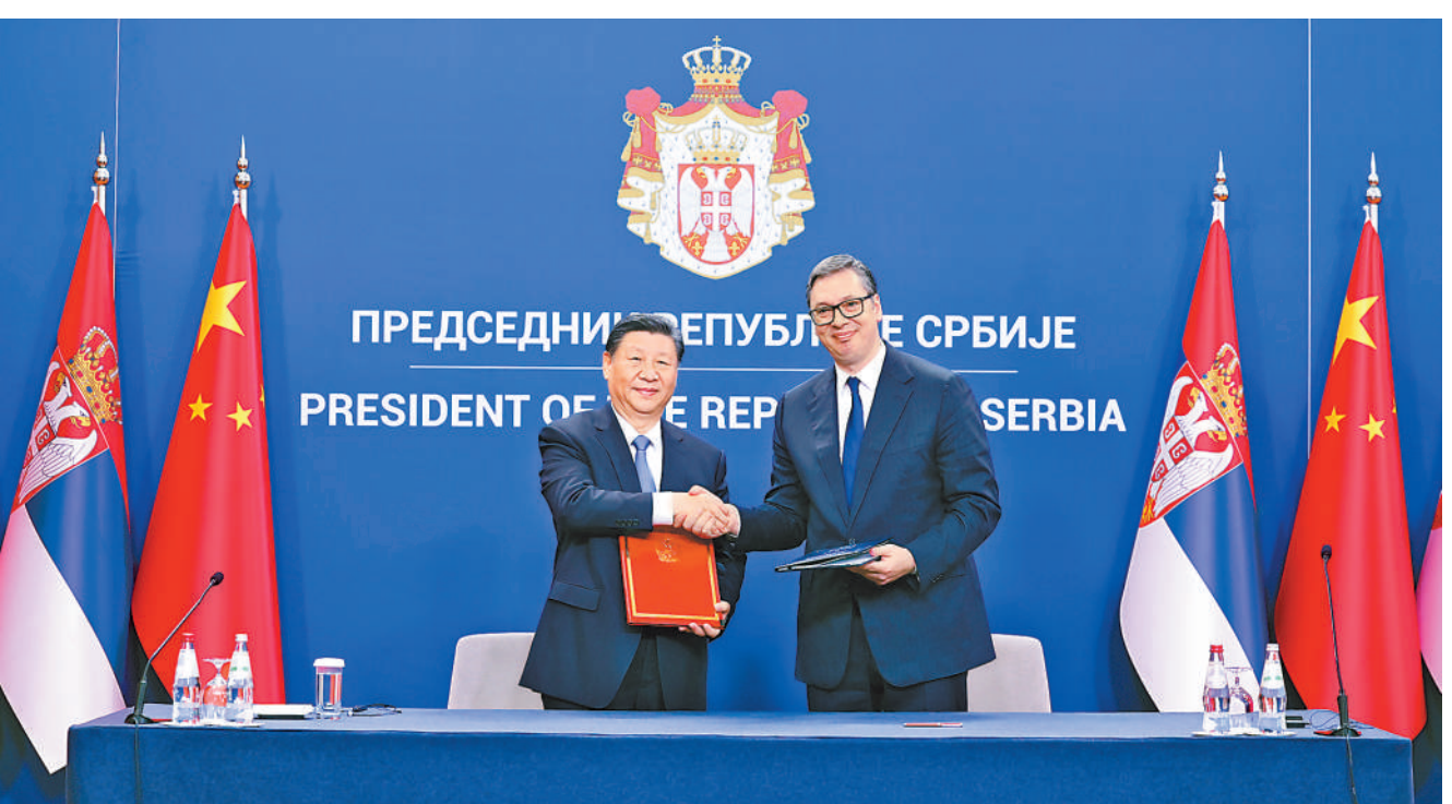
当地时间5月8日上午,国家主席习近平在贝尔格莱德塞尔维亚大厦同塞尔维亚总统武契奇举行会谈。会谈后,两国元首共同签署《关于深化和提升中塞全面战略伙伴关系、构建新时代中塞命运共同体的联合声明》。