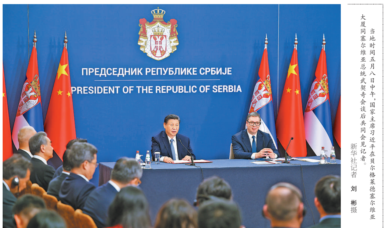
当地时间五月八日中午,国家主席习近平在贝尔格莱德塞尔维亚大厦同塞尔维亚总统武契奇会谈后共同会见记者。