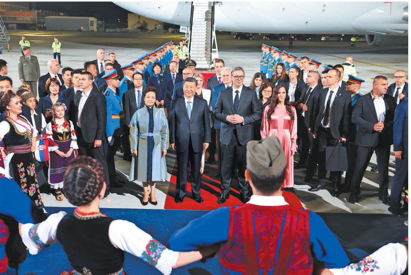
当地时间5月7日晚,国家主席习近平乘专机抵达贝尔格莱德,应塞尔维亚总统武契奇邀请,对塞尔维亚进行国事访问。习近平乘坐专机抵达贝尔格莱德尼古拉·特斯拉国际机场时,塞尔维亚总统武契奇夫妇,对华合作国家委员会主席、前总统尼科利奇夫妇,议长布尔纳奇,总理武切维奇和外长久里奇等热情迎接。