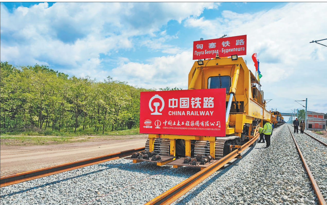
近日，在塞尔维亚和匈牙利边境地区的塞尔维亚一侧，匈塞铁路项目施工人员利用铺轨车等中国设备进行铺轨作业。