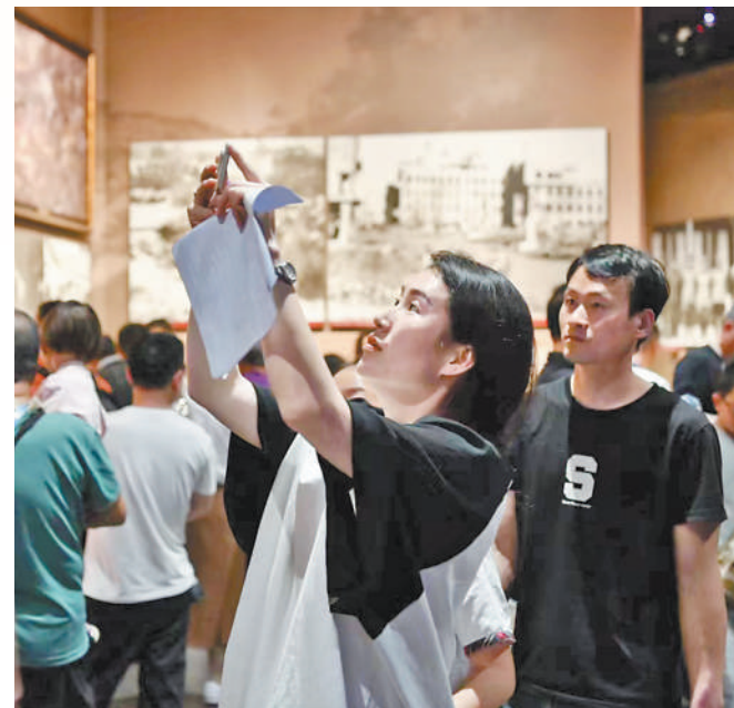
▲辽宁省丹东市抗美援朝纪念馆内,观众在展板前拍照。