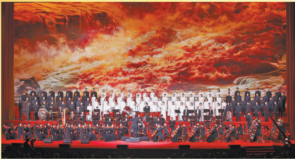
▲作为第五届中国广播艺术团艺术季开幕演出,“纪念《黄河大合唱》首演85周年特别音乐会”在北京人民大会堂上演。 ▲新疆维吾尔自治区乌鲁木齐市科技馆,游客在体验隔空点灯实验。