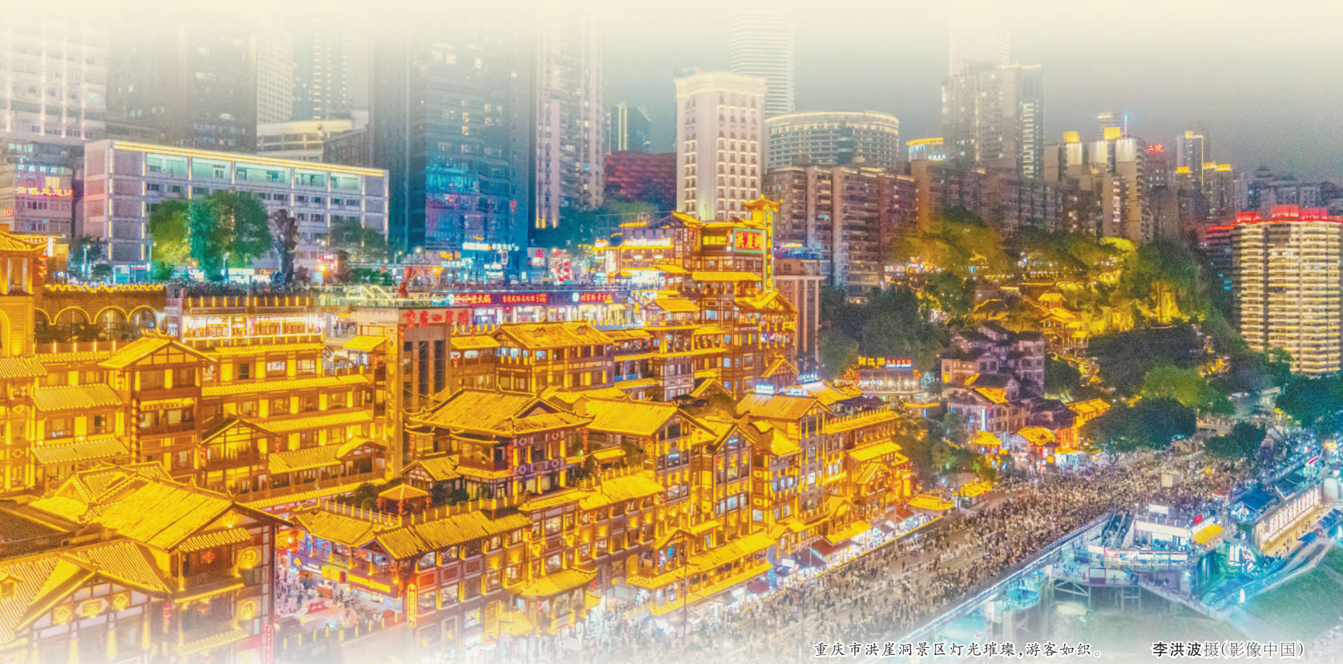
重庆市洪崖洞景区灯光璀璨,游客如织。