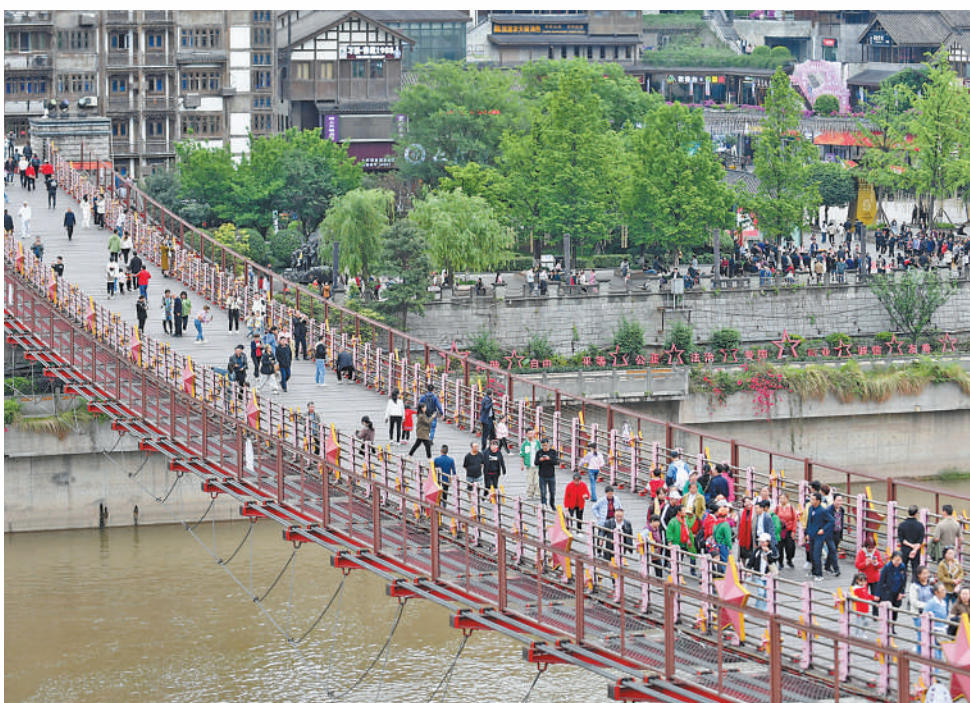
▲贵州省仁怀市茅台镇茅台渡口,游客在铁索桥上行走。