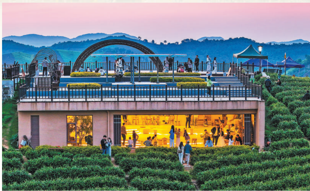
▲浙江省湖州市安吉县溪龙乡白茶观景平台上,游客体验农文旅新业态。

“五一”假期,文旅市场延续加快恢复势头,呈现供需两旺的发展态势。从文化场馆到商业街区,从红色旅游到乡村旅游,从短途周边游到远距长线游,新业态新场景不断涌现,文旅消费潜能持续释放。 文旅市场新意更足。各地各部门发力智慧文旅,加快新技术在文旅领域的应用,为游客带来全新体验。在新疆维吾尔自治区阜康市飞览天下·新疆会客厅,游客可以沉浸式感受技术与景色融合带来的精彩。搭乘飞行座椅,游客可体验急速拉升、失重、俯冲、滑翔,“游览”巴音布鲁克草原、赛里木湖等风景名胜。 假期的文化味更浓。“五一”假期各地博物馆、文化馆接待游客量明显增长。多家文博场馆推出新展,为游客提供更高质量的文旅体验。中国考古博物馆“中国八千年龙文化精品文物展”受到欢迎,100多件龙主题文物向游客讲述龙文化的起源、发展和演变。 “五一”假期前,文化和旅游部启动2024年全国文化和旅游消费促进活动暨全国“五一”文化和旅游消费周主场活动。假日期间,河北省围绕传统民俗、非遗体验、温泉养生、特色美食等主题,推出近百项惠民举措。浙江省推出文旅消费券发放、景区门票减免、餐饮住宿优惠等形式多样的惠民举措。重庆市推出102场文旅节庆活动、186场群众文化活动、230场文艺演出,80余场文博展览展示。各地举办的丰富活动、出台的惠民举措,为文旅消费注入新活力,更好地满足人们精神文化需求。(本报记者 王珂)