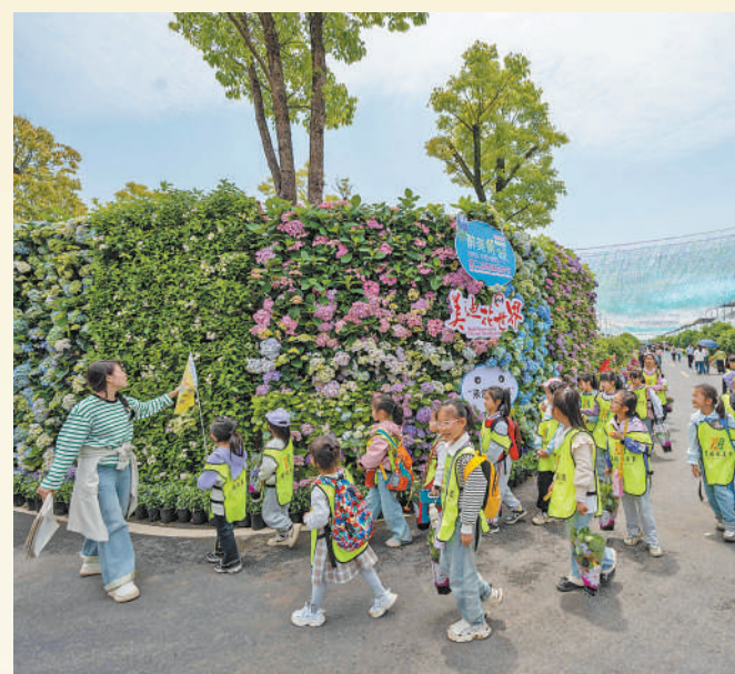
▲安徽省宣城市郎溪县涛城镇庆丰村花卉基地,老师带着小朋友们参观研学。