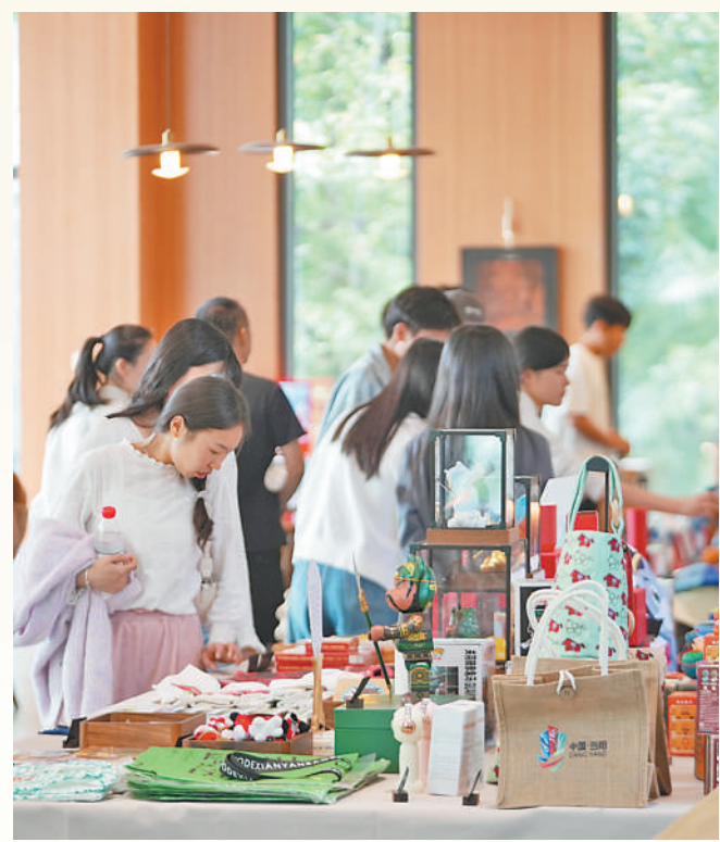
▲湖北省当阳市花溪湿地,游客在选购文创产品。

“五一”假期,文旅市场延续加快恢复势头,呈现供需两旺的发展态势。从文化场馆到商业街区,从红色旅游到乡村旅游,从短途周边游到远距长线游,新业态新场景不断涌现,文旅消费潜能持续释放。 文旅市场新意更足。各地各部门发力智慧文旅,加快新技术在文旅领域的应用,为游客带来全新体验。在新疆维吾尔自治区阜康市飞览天下·新疆会客厅,游客可以沉浸式感受技术与景色融合带来的精彩。搭乘飞行座椅,游客可体验急速拉升、失重、俯冲、滑翔,“游览”巴音布鲁克草原、赛里木湖等风景名胜。 假期的文化味更浓。“五一”假期各地博物馆、文化馆接待游客量明显增长。多家文博场馆推出新展,为游客提供更高质量的文旅体验。中国考古博物馆“中国八千年龙文化精品文物展”受到欢迎,100多件龙主题文物向游客讲述龙文化的起源、发展和演变。 “五一”假期前,文化和旅游部启动2024年全国文化和旅游消费促进活动暨全国“五一”文化和旅游消费周主场活动。假日期间,河北省围绕传统民俗、非遗体验、温泉养生、特色美食等主题,推出近百项惠民举措。浙江省推出文旅消费券发放、景区门票减免、餐饮住宿优惠等形式多样的惠民举措。重庆市推出102场文旅节庆活动、186场群众文化活动、230场文艺演出,80余场文博展览展示。各地举办的丰富活动、出台的惠民举措,为文旅消费注入新活力,更好地满足人们精神文化需求。(本报记者 王珂)