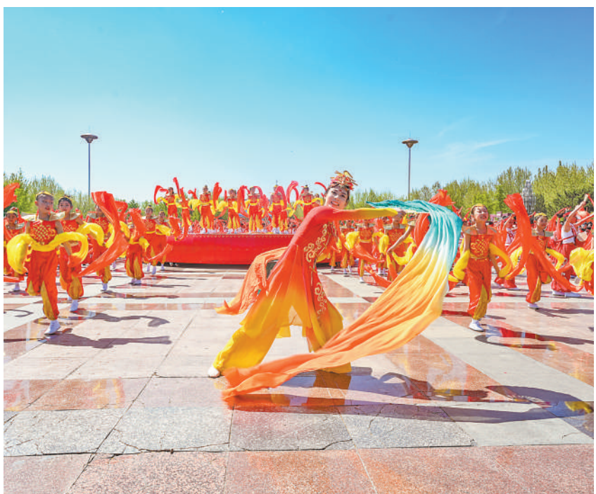
▲河北省乐亭县举行的“五月青春秀”文化活动中,演员在表演。