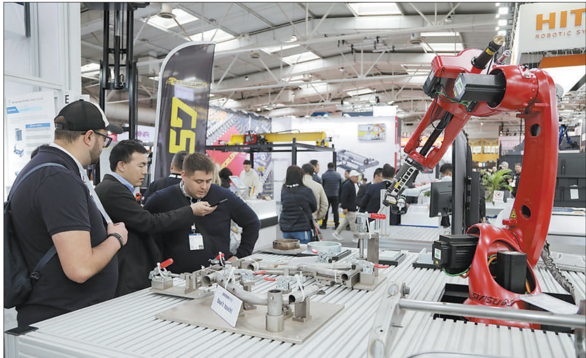
本届汉诺威工业博览会上，沈阳新松机器人公司展示的工业焊接机器人受到外国客户关注。