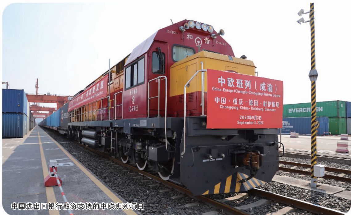
中国进出口银行融资支持的中欧班列项目