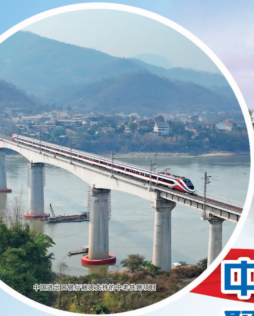
中国进出口银行融资支持的中老铁路项目