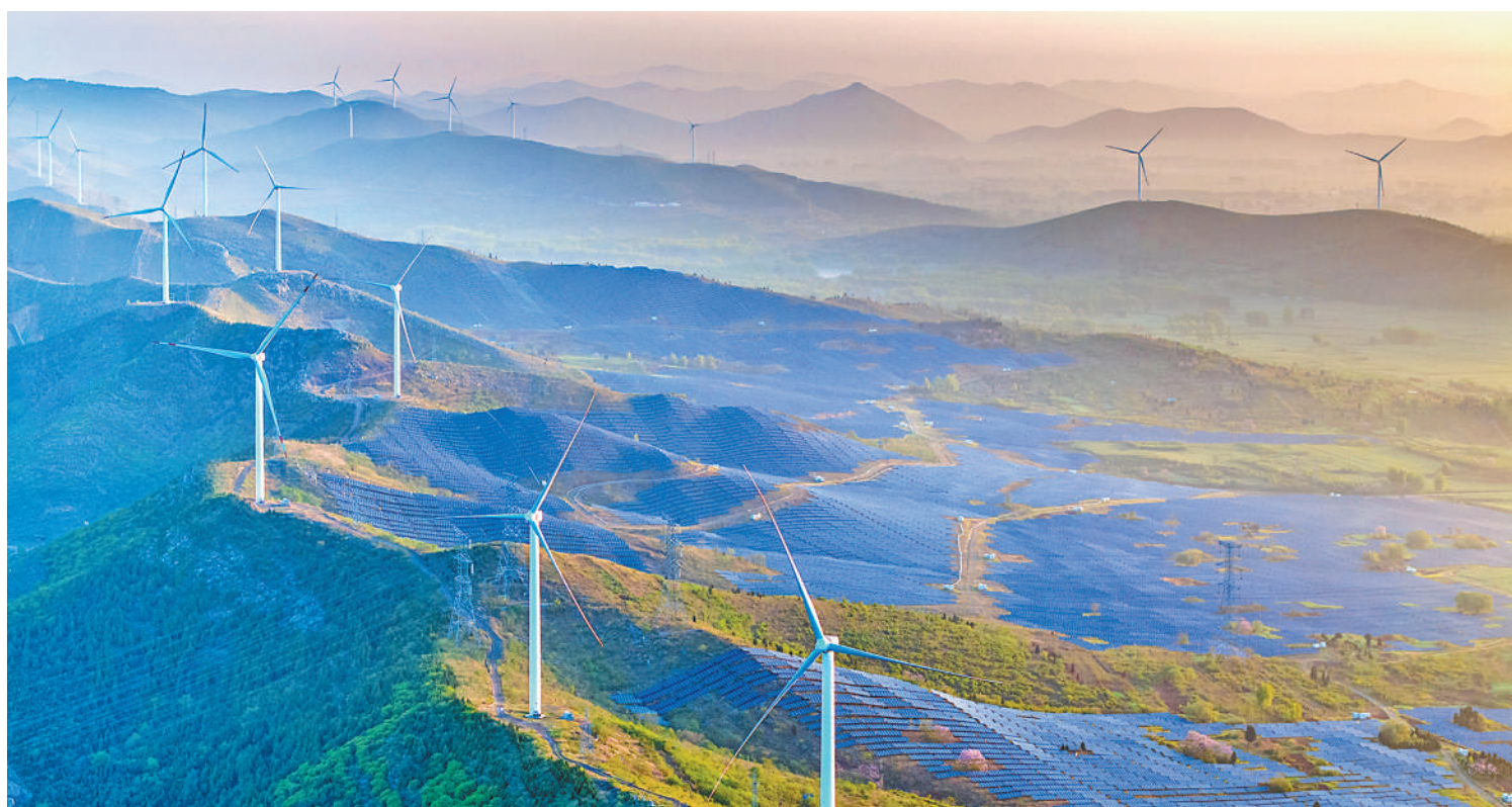
近年来,安徽省宿州市大力构建绿色低碳循环经济体系,积极发展风电、光伏等绿色能源产业,探索“绿色能源+农业”互补模式,推动当地经济高质量发展,带动群众增收致富。图为宿州市埇桥区的一处风电场及光伏发电项目。

习近平总书记强调:“提振党员干部干事创业的精气神”“看准了就抓紧干,把各方面的干劲带起来”。强国建设、民族复兴的新征程,没有捷径,唯有实干。党员干部要拿出“咬定目标不放松,敢闯敢干加实干”的劲头,增强“时时放心不下”的责任感,提升“事事心中有底”的行动力,靠实干增强信心,用奋斗凝聚力量,团结带领群众一起创造更美好的生活。