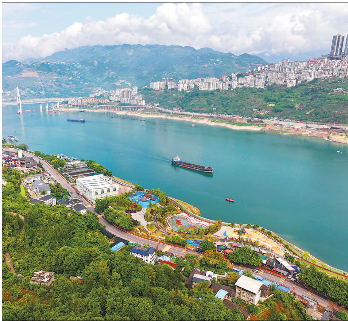
近年来，湖北省恩施土家族苗族自治州巴东县通过长江干流库岸综合整治，建成亲水广场和儿童公园，成为市民休闲健身的好地方，形成一道美丽的风景线。图为4月17日拍摄的巴东县沿江生态廊道风景。

通知要求，各地要不断创新方式方法，充分激发各类群体的学习兴趣，利用好公共文化设施，为人民群众就近就便学习提供更多机会和条件；通过开展主题阅读、开设线上社会大讲堂、数字阅读分享等活动，持续打造品牌阅读活动，结合全国青少年和老年人读书行动，推进学习型家庭、学习型社区建设；宣传推介学习典型人物、感人事迹，引导广大群众尚学、乐学、善学；坚持突出地域特色，统筹学习资源，引导广大群众参与终身学习。通知还注重推动数字学习，要求构建共享开放的终身学习公共服务平台，提供数量充足、质量优良的数字学习资源。