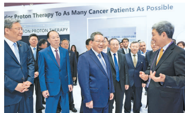
4月18日,国务院总理李强在第135届中国进出口商品交易会(广交会)企业馆巡馆。

经济增长乏力、贸易保护主义抬头等不利影响,我国外贸展现出很强的韧性和竞争力,其中凝聚着广大外贸企业的辛勤奋斗。希望外贸企业在进一步开拓国际市场、不断提升产品质量和附加值、积极参与国际标准制定上下功夫,走拼创新、拼品质、拼品牌的新路,靠过硬的技术、质量和服务赢得市场、赢得未来。政府部门要为外贸企业提供有力支持、有效指导、优质服务,让企业真正享受到政策红利,维护好企业合法权益,做企业开拓市场、创新发展的坚强后盾。