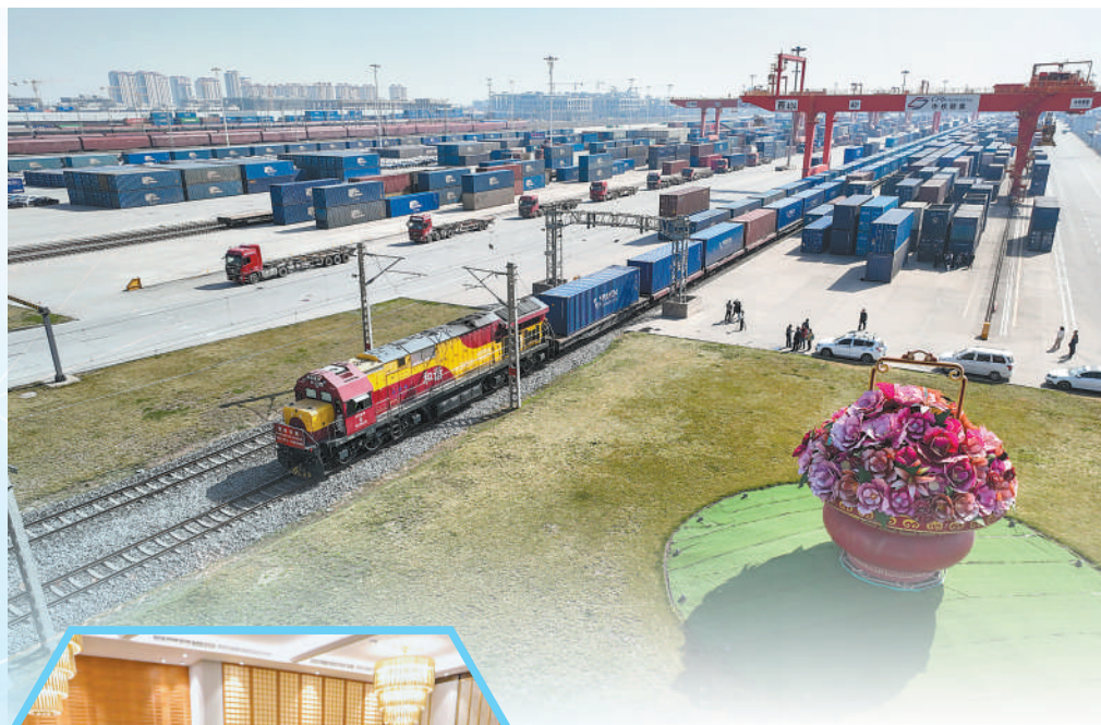
▲3月21日,陕西西安开行首趟至南美洲国家的国际铁海联运班列,搭载彩色液晶显示板等货物的列车从西安国际港站驶出,一路开往山东青岛港,并从青岛港转海运前往巴西马瑙斯。