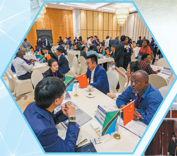
▲3月27日,中坦投资论坛在坦桑尼亚达累斯萨拉姆举行,来自中国的投资者和坦桑尼亚的企业代表深入交流。