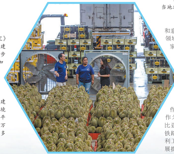
▶随着《区域全面经济伙伴关系协定》(RCEP)红利释放,中国—东盟自贸区建设深入推进,中国—东盟贸易规模进一步扩大,越来越多东盟国家的商品得以更加便捷地进入中国市场。图为泰国春蓬府一家榴莲工厂的工作人员查看刚采摘的榴莲。

米凯莱·杰拉奇:中国是推动国际合作和全球化的关键力量。数据显示,中国企业在非洲新签承包工程合同额超7000亿美元,完成营业额超4000亿美元,帮助非洲共同建设各类基础设施项目,促进了非洲国家可持续发展。中国