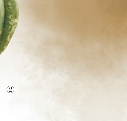
图②:善夫吉父鬲,现藏于中国文字博物馆。