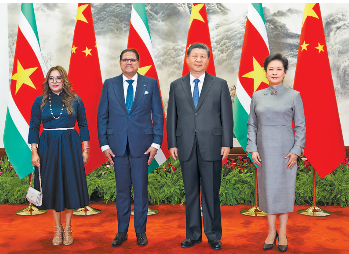
四月十二日下午,国家主席习近平在北京人民大会堂同苏里南总统单多吉举行会谈。这是会谈前,习近平和夫人彭丽媛同单多吉和夫人梅莉萨合影。