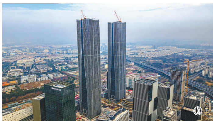
图⑩:坐落于上海张江科学城及张江城市副中心内的“科学之门”。