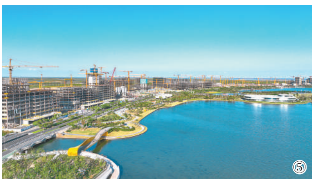
图⑤:建设中的临港新片区滴水湖金融湾。