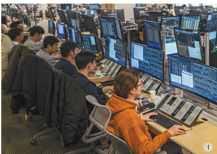
图④:上海国际货币经纪有限责任公司的债券经纪人在撮合交易。上海金融服务产业链不断完善,金融市场成交活跃,交易额持续增长。