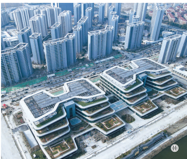
图⑪:临港新片区上海顶尖科学家社区项目现场。建成后将为科研人员提供便捷的协作空间和“绿色”的居住场所,助力打造未来创新产业研发高地。 中建二局供图

本版图片除标明出处外均 为王初摄 本版策划:纪雅林 吴 燕 本版责编:臧春蕾 张伟昊 邓剑洋 董映雪 版式设计:张芳曼