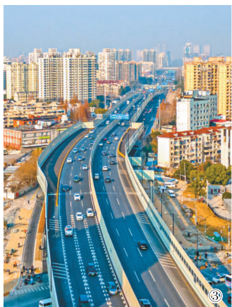
图③:改建后的上海杨高南路成山路段。全长26.6公里的杨高路及延伸线林公路改建工程竣工通车,串联起浦东内环、中环和外环,进一步完善浦东交通功能,助力浦东高水平改革开放。