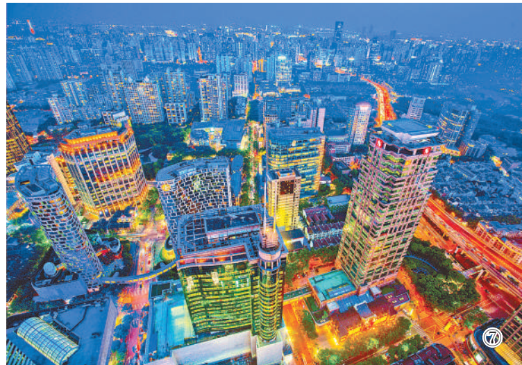
图⑦:上海淮海新天地进口贸易功能区的璀璨夜景。