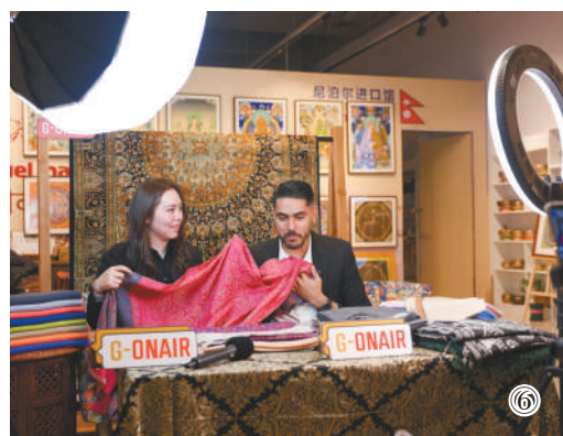
图⑥:在绿地全球商品贸易港,尼泊尔商人通过线上“进博集市”推介产品。第七届进博会筹办工作已全面启动。目前,企业商业展签约面积已超24万平方米,签约企业数量超600家。