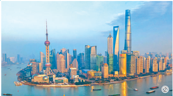
图②:远眺陆家嘴地标建筑群。这里活跃着4.5万多家企业、拥有12家国家级要素市场和金融基础设施。