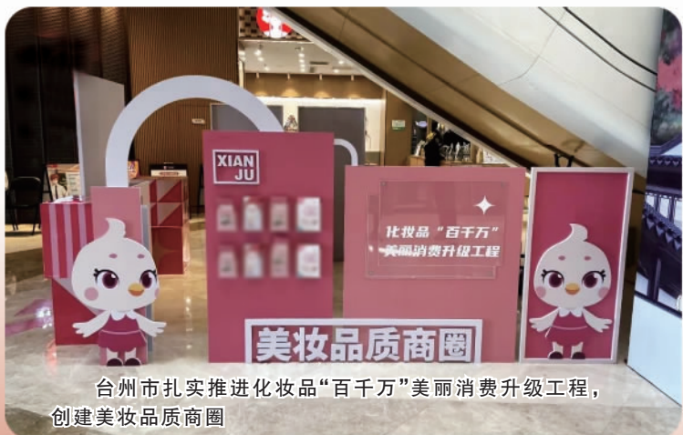
台州市扎实推进化妆品“百千万”美丽消费升级工程,创建美妆品质商圈