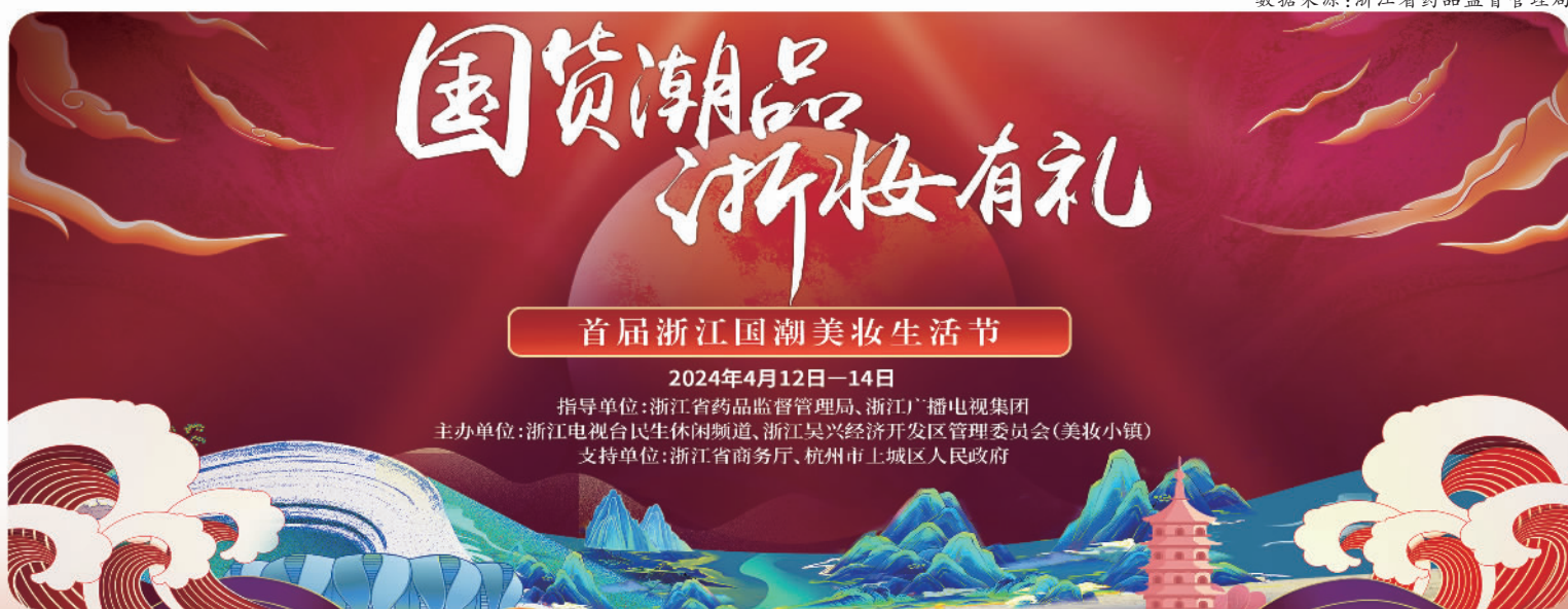
首届浙江国潮美妆生活节 2024年4月12日-14日 指导单位:浙江省药品监督管理局、浙江广播电视集团 主办单位:浙江电视台民生休闲频道、浙江吴兴经济开发区管理委员会(美妆小镇) 支持单位:浙江省商务厅、杭州市上城区人民政府