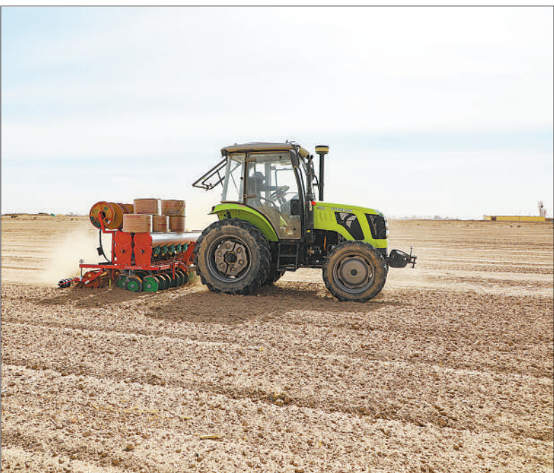
上图:民勤县的农民操作农机在采用浅埋滴灌技术的田里播种。

良种播下,良法跟上。“公司对种植户进行技术指导,水稻管理高标准,深化科研院企的合作力度,在社化服务、智能化管理和农业生产全流程遥感监测方向持续发力,用科技的力量助力好种子带来好收成。”