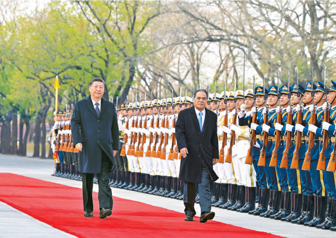
四月九日下午，国家主席习近平在北京人民大会堂同来华进行国事访问的密克罗尼西亚联邦总统西米纳举行会谈。这是会谈前，习近平在人民大会堂东门外广场为西米纳举行欢迎仪式。