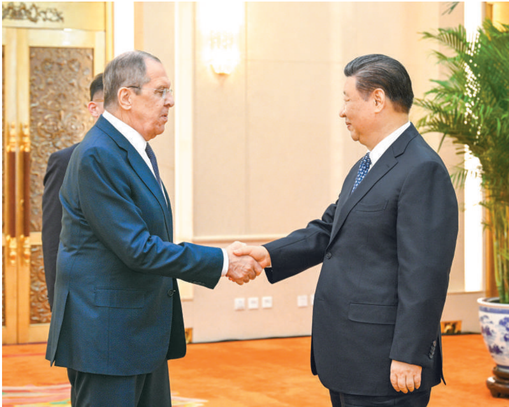
4月9日下午，国家主席习近平在北京人民大会堂会见俄罗斯外长拉夫罗夫。