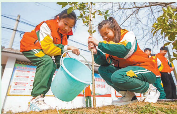
开展全民义务植树是推进国土绿化、建设美丽中国的生动实践。近年来江苏省积极组织义务植树活动进校园,提升学生爱绿植绿护绿意识。图为南京市南莫镇中心小学学生在唐庄河岸边参与义务植树活动。