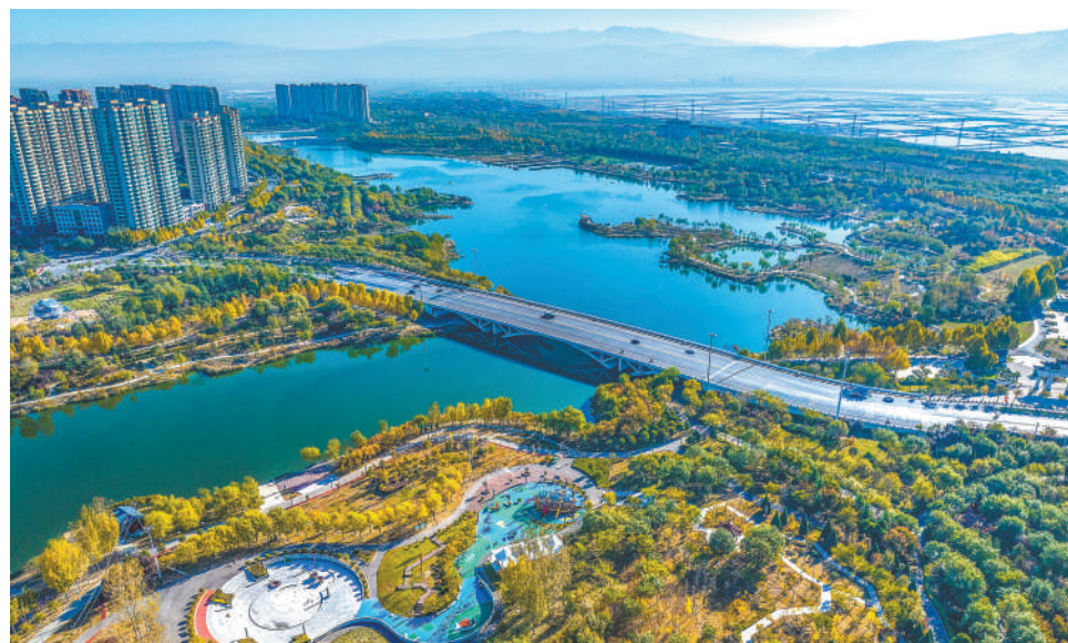
各地把绿色发展理念融入城乡规划建设管理之中,不断完善城市公园体系和绿道网络,高品质生态环境成为城市高质量发展的重要支撑。图为山西省运城市禹都公园,草木茂盛,景色怡人。