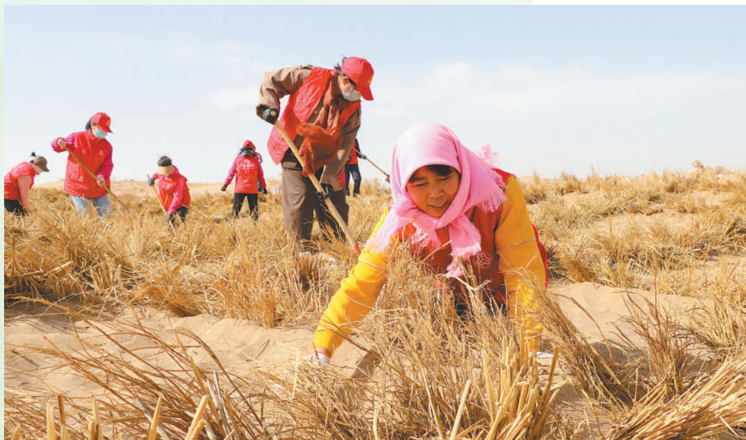
甘肃省通过跨区域综合治理等方式,全面推进“三北”工程攻坚战标志性战役。图为武威市民勤县上新村村民在进行压沙作业。 资料照片