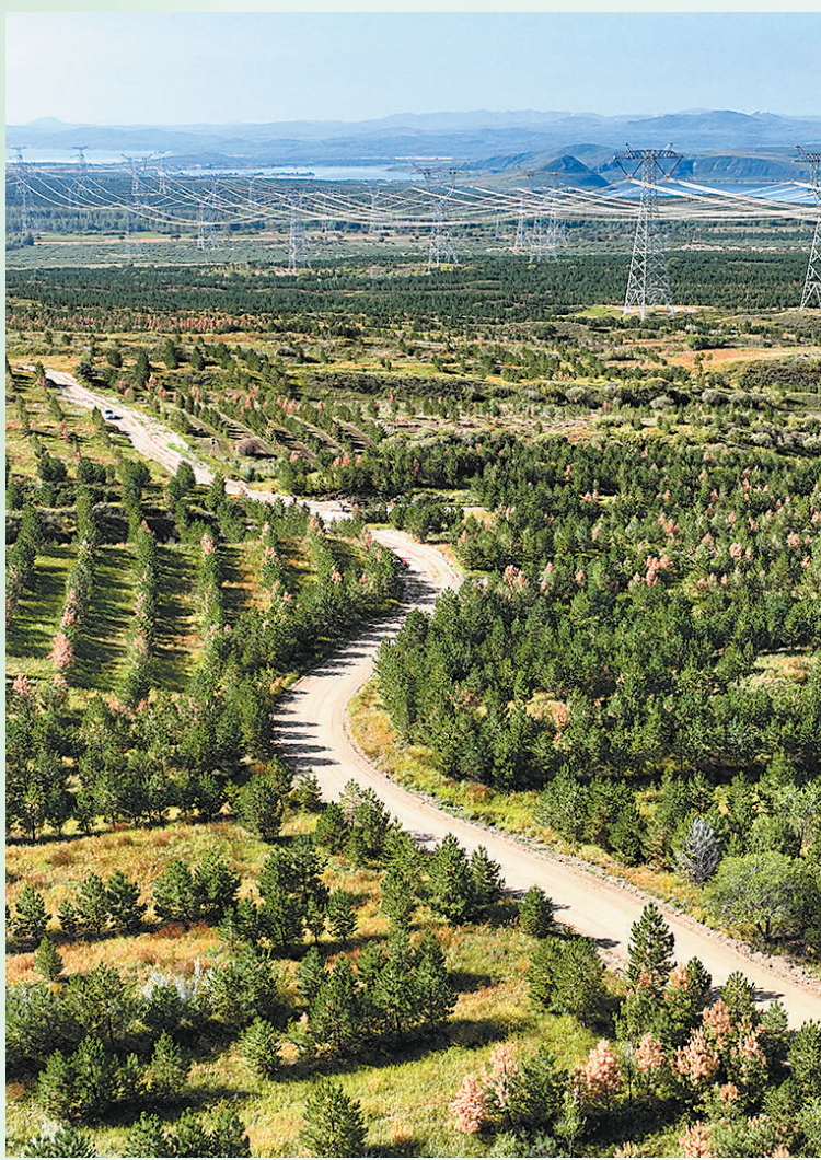
“三北”工程攻坚战全面启动以来,“三北”工程区林草植被质量、生态系统质量持续提升。内蒙古自治区多措并举努力打好“三北”工程攻坚战。图为2023年9月锡林郭勒盟多伦县的固沙樟子松林。