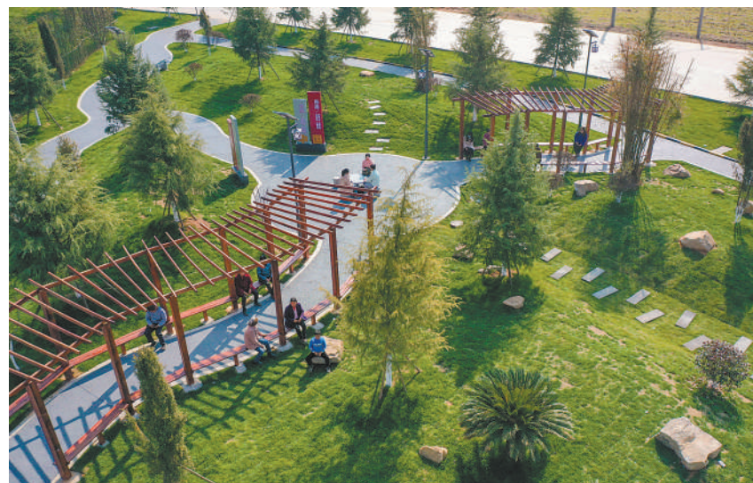
近年来,我国城乡绿化美化协调推进,人居环境显著改善。图为江西省吉安市吉水县冠山乡利用闲置空间打造的“口袋公园”。