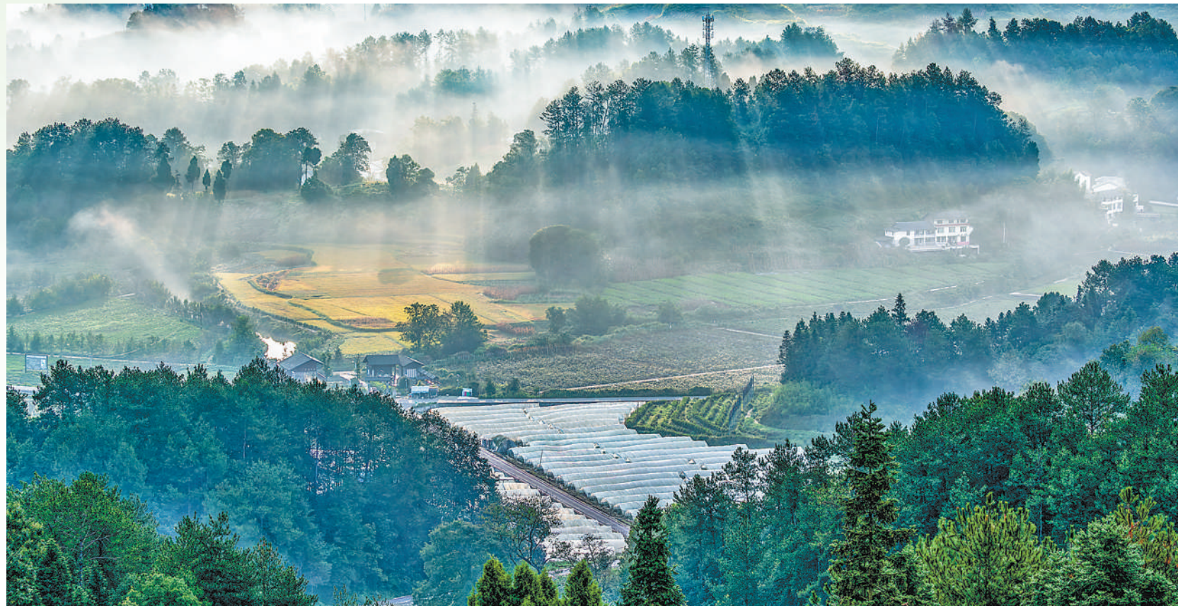
开展大规模国土绿化行动是新时代以来党中央、国务院确定的一项重大任务,我国森林覆盖率目前已达到24%以上。重庆市通过植树造林、封山育林等方式推动石漠化综合治理。图为南川区经综合治理后的良好生态。