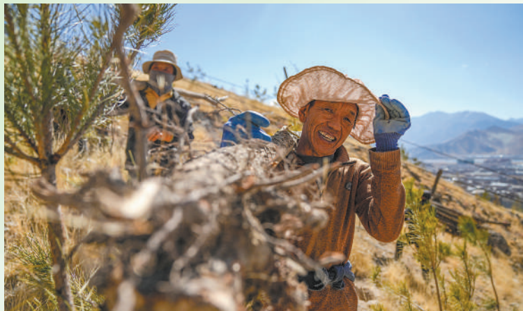
全民义务植树活动开展40余年来,植树造林和国土绿化事业取得显著成效。图为西藏自治区拉萨市堆龙德庆区东嘎社区二组的村民在西嘎山上搬运树苗。