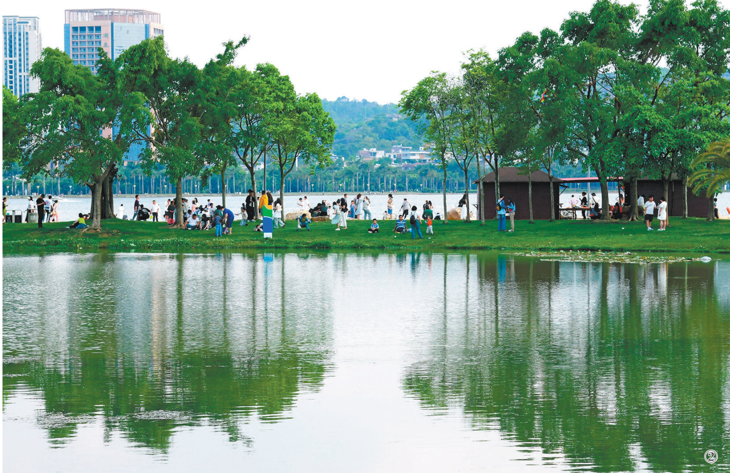
清明节假期,各地群众踏青出游,尽享春光。