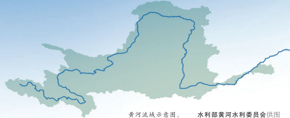
黄河流域示意图。