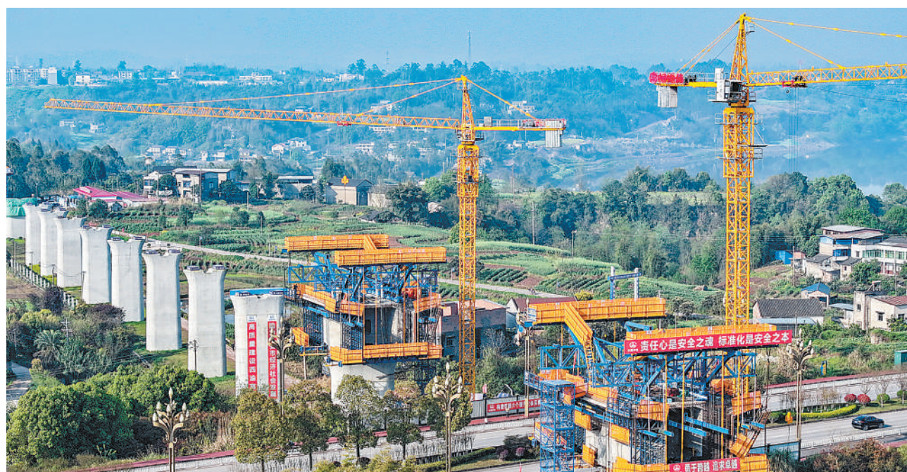
西渝高铁是我国“八纵八横”高速铁路网中京昆通道和包(银)海通道的重要组成部分,建成后推动中西部地区路网结构进一步完善。图为3月28日,西渝高铁四川华蓥溪渡口特大桥建设现场。