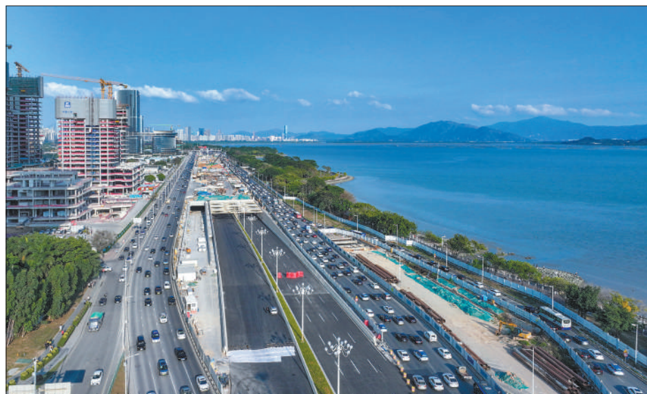
广东深圳市滨海大道（总部基地段）交通综合改造工程施工全长约5.95千米，其中下沉隧道段1.56千米，建成后将成为“地面+地下”立体交通，可完善城市干线路网，释放更多高品质公共空间。图为改造工程建设现场。