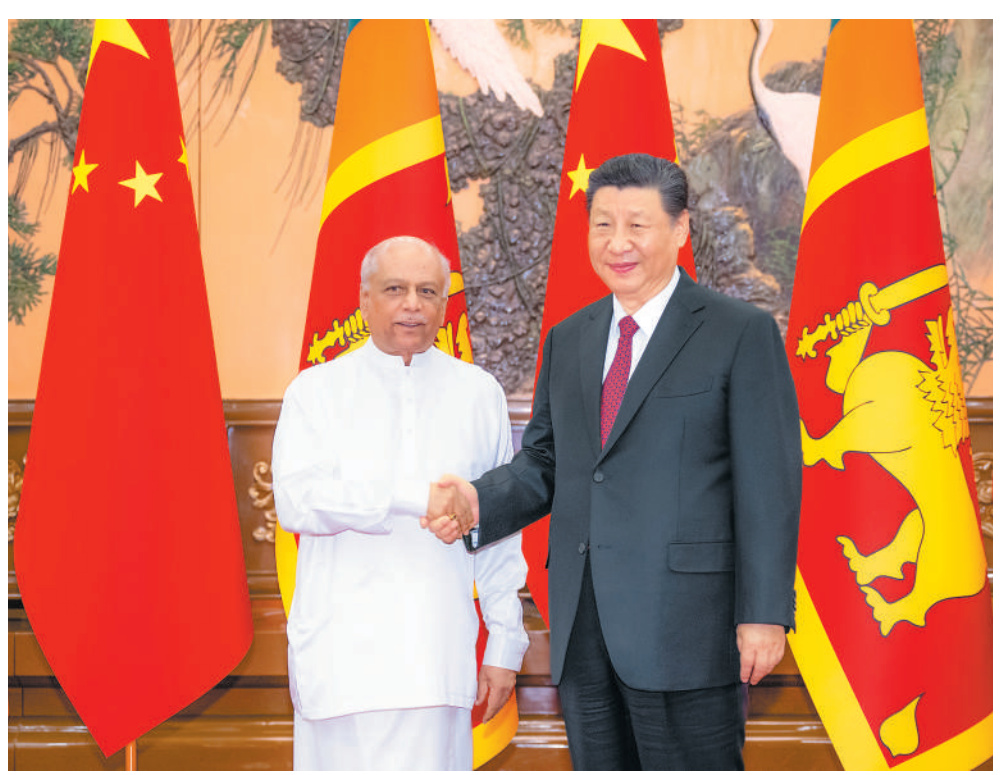
3月27日下午,国家主席习近平在北京人民大会堂会见来华进行正式访问的斯里兰卡总理古纳瓦德纳。

民族尊严,探索符合本国国情的现代化道路,将继续为斯里兰卡经济社会发展提供力所能及的帮助。双方要共同努力,推进高质量共建“一带一路”,特别是科伦坡港口城和汉班托塔综合开发两大旗舰项目,深化物流、能源、产业合作,加强数字经济、绿色经济、清洁能源、文化旅游、海洋经济等领域交流合作。中方愿继续扩大进口斯里兰卡特色优质产品,鼓励中国企业赴斯里兰卡投资兴业,希望斯方提供公平、透明的营商环境。中方愿同斯方加强乡村减贫合作,助力斯里兰卡实现经济转型升级和可持续发展。双方应该进一步弘扬和平共处五项原则,加强在国际和地区事务中的协作,维护好中斯共同利益和国际公平正义,推动构建人类命运共同体。 古纳瓦德纳表示,斯中传统友好。斯方毫不含糊恪守一个中国原则,毫不含糊奉行对华友好合作政策,始终将中国置于对外关系的