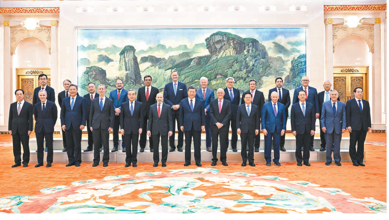
3月27日,国家主席习近平在北京人民大会堂集体会见美国工商界和战略学术界代表。

中美关系是世界上最重要的双边关系之一。中美两国是合作还是对抗,事关两国人民福祉和人类前途命运。中美各自的成功是彼此的机遇。只要双方都把对方视为伙伴,相互尊重、和平共处、合作共赢,中美关系就会好起来。今年是中美建交45周年。中美关系史是一部两国人民友好交往的历史,过去靠人民书写,未来更要靠人民创造。中国有句话,从善如登,从恶如崩。希望两国各界人士多来往、多交流,不断积累共识,增进信任,排除各种干扰,深化互利合作,为两国人民带来更多实实在在的福祉,为世界注入更多稳定性。 中国经济是健康、可持续的。去年中国经济增速在世界主要经济体中名列前茅,对世界经济增长贡献率继续超过30%,这是中国人民干出来的,也离不开国际合作。中国的发展历经各种困难挑战才走到今天,过去没有因为“中国崩溃论”而崩溃,现在也不会因为“中国见顶论”而见顶。我们将持续推动高质量发展,持续推进中国式现代化,既让中国人民不断过上更好生活,也为世界可持续发展作出更大贡献。中国发展前景是光明的,我们有这个底气和信心。 我多次讲过,改革开放是当代中国大踏步赶上时代的重要法宝。中国的改革不会停顿,开放不会止步。我们正在谋划和实施一系列全面深化改革开放重大举措,持续建设市场化、法治化、国际化一流营商环境,为包括美国企业在内的各国企业提供更广阔发展空间。面对中美经贸关系近年来出现的新情况新变化,双方要坚持相互尊重、互惠互利、平等协商,按经济规律和市场规则办事,扩大和深化经贸互利合作,尊重彼此的发展权利,追求中美共赢和世界共赢。欢迎美国企业更多参与共建“一带一路”,参加中国国际进口博览会等大型经贸活动,继续投资中国、深耕中国、赢在中国。 这几年,中美关系经历了不少波折,也遭遇过严峻挑战,其中的教训值得吸取。中美关系回不到过去,但能够有一个更好的未来。去年我同拜登总统在旧金山会晤,最大的共识就是中美关系应该稳下来、好起来。过去几个月,双方团队围绕我和拜登总统达成的共识,在政治外交、经贸财金、执法禁毒、气候变化、人文交流等各领域保持沟通,取得了进展。当前形势下,中美的共同利益不是减少了,而是更多了。不管是经贸、农业等传统领域,还是气候变化、人工智能等新兴领域,中美应该成为对方发展的助力,而不应该成为阻力。推动世界经济复苏、解决国际和地区热点问题,都需要中美协调合作,展现大国胸怀,拿出大国担当。美方应同中方相向而行,树立正确战略认知,妥善处理敏感问题,保持中美关系止跌企稳的势头,积极探索正确相处之道,推动中美关系持续稳定健康向前发展。