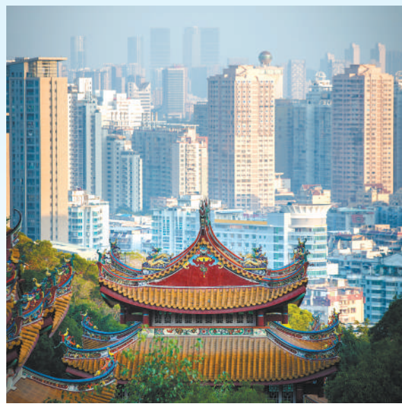
◀厦门富有地方特色的古代建筑与现代楼宇交融。