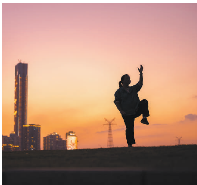
▶夕阳下,正在练习中国武术的厦门市民,与远处的风景构成了一幅美丽的剪影图。

2023年9月,我曾前往厦门参加由中国商务部主办、福建海洋研究所承办的“中国—马达加斯加—莫桑比克国际合作航次数据处理培训班”。高楼林立、桥美路畅、蓝天碧海是厦门留给我的直观印象。通过案例学习和参观考察,我了解到厦门的发展离不开海洋治理与保护,也深刻认识到合理开发与利用海洋资源的重要意义。我要把中国海洋治理保护的优秀案例带回国去,为马达加斯加未来发展贡献力量。