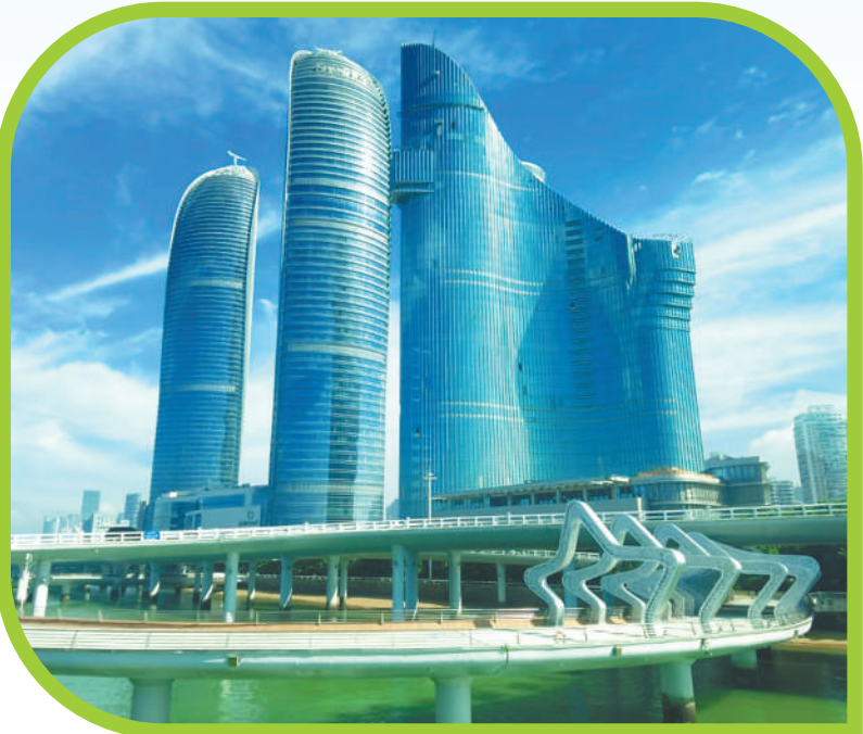
▲厦门地标性建筑世茂海峡大厦。

福建厦门是习近平生态文明思想的重要孕育地和先行实践地。30多年来,从筲筍湖综合治理出发,厦门积极推进“海域、流域、全域”生态保护修复,不断探索构建从山顶到海洋的保护治理大格局。如今,抬头仰望是清新的蓝,环顾四周是怡人的绿。外国友人镜头中的厦门,在碧波万顷的海洋滋润下,迸发出蓬勃的生机与活力,展现绿水青山与金山银山有机统一、人与自然和谐共生的生动图景。