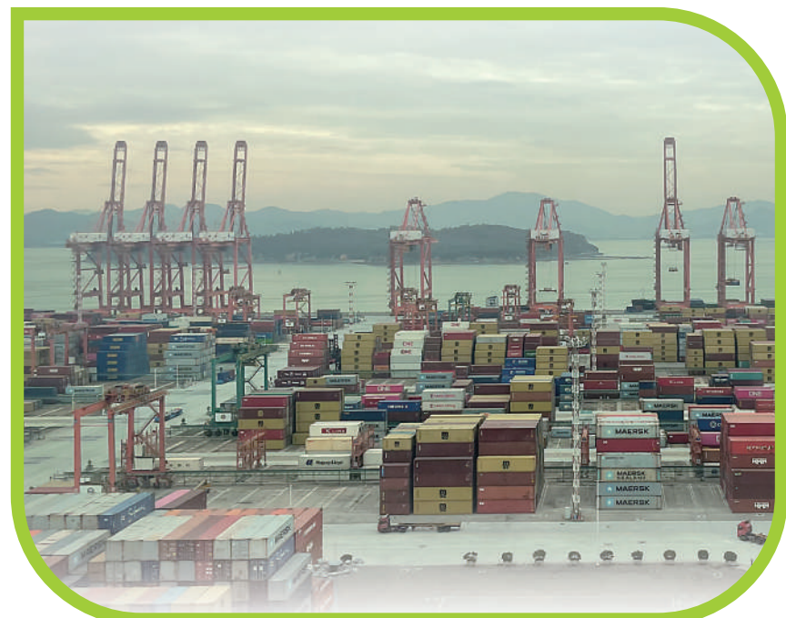
(本版文字由本报记者陈尚文、包晗、周翱采访整理)

中国是全球最大货物出口国。我曾对中国是如何实现如此庞大的出口量充满好奇。在前往厦门海润码头参观时,亲眼看到自动化吊机将一个个集装箱整齐堆叠,纯电动巡逻车和叉车忙碌往返,先进的中国技术解答了我心中的疑问。