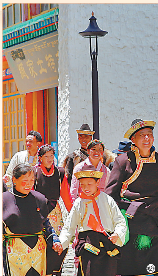
图①：村落景观。 图②：快乐村民。 图③：雪山山村。 版式设计：张丹峰

木葱茏，浓浓的绿意中夹杂着簇簇粉红。扎西岗村与南迦巴瓦峰、色季拉国家森林公园、鲁朗林海等多个景区相邻，下辖的两个自然村落坐落于高山峡谷间，清澈的鲁朗河从村前流过，向东汇入雅鲁藏布江。目前，这里67户人家中有51户开办了家庭旅馆。民族特色建筑仿佛彩色积木，别具一格，高原田园风光因时而异，吸引了大量游客前来。