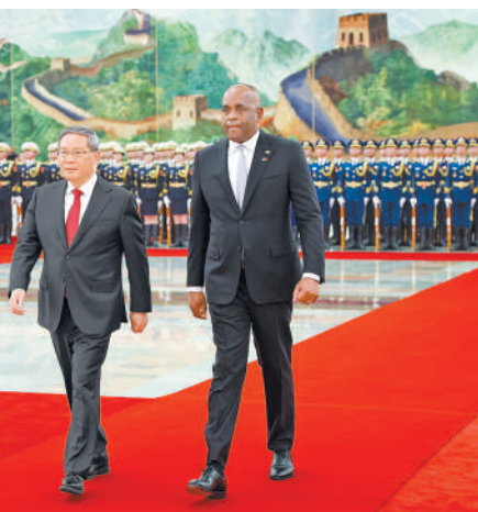
3月25日上午,国务院总理李强在北京人民大会堂会见来华进行正式访问的多米尼克总理斯凯里特举行会谈。这是会谈前,李强在人民大会堂北大厅为斯凯里特举行欢迎仪式。

李强指出,中方始终支持多维护国家主权独立,走符合自身国情的发展道路,愿同多一道在共建“一带一路”框架下不断加强基础设施建设、农业、贸易等传统领域合作,打造新能源、数字经济、蓝色经济等新合作新亮点,帮助多提高防灾减灾能力,分享更多发展机遇。中方支持中国企业赴多投资兴业,欢迎多米尼克等加勒比国家积极参加第四届中国—加勒比经贸合作论坛,为中加经贸合作开辟更广阔前景。双方要加强文旅、教育等人文交流合作。中方愿同多一道在多边领域协调配合,维护发展中国家共同利益,推动构建人类命运共同体。(下转第二版)