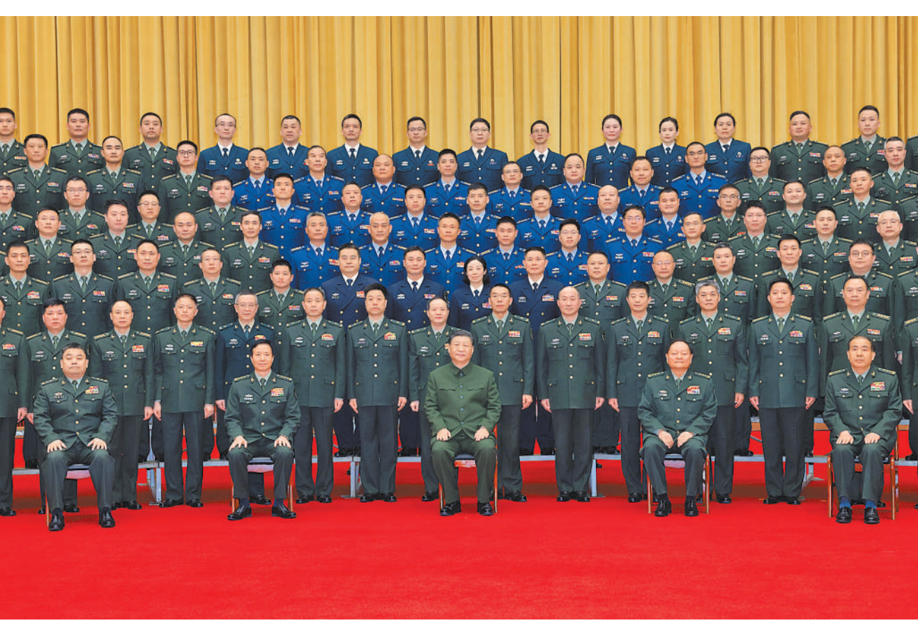
3月18日至21日,中共中央总书记、国家主席、中央军委主席习近平在湖南考察。这是20日上午,习近平在长沙亲切接见驻长沙部队上校以上领导干部,代表党中央和中央军委向驻长沙部队全体官兵致以诚挚问候。

本报长沙3月21日电 中共中央总书记、国家主席、中央军委主席习近平近日在湖南考察时强调,湖南要牢牢把握自身在构建新发展格局中的战略定位,坚持稳中求进工作总基调,坚持高质量发展不动摇,坚持改革创新、求真务实,在打造国家重要先进制造业高地、具有核心竞争力的科技创新高地、内陆地区改革开放高地上持续用力,在推动中部地区崛起和长江经济带发展中奋勇争先,奋力谱写中国式现代化湖南篇章。 3月18日至21日,习近平在湖南省委书记沈晓明和省长毛伟明陪同下,先后来到长沙、常德等地,深入学校、企业、历史文化街区、乡村等进行调研。 18日下午,习近平来到湖南第一师范学院(城南书院校区)考察。该校前身是创办于宋代的城南书院,近代以来培养了一批老前辈无产阶级革命家和名师大家。习近平参观青年毛泽东主题展览,了解学院发展沿革和用好红色资源等情况。在学院大厅,习近平同师生代表亲切交流。他说,国家要强大,必须办好教育。一师是开展爱国主义教育、传承红色基因的好地方,要把这一红色资源保护运用好。学校要立德树人,教师要当好大先生,不仅要注重提高学生知识文化素养,更要上好思政课,教育引导好学生明德知耻,树牢社会主义核心价值观,立报国强国大志向,努力成为堪当强国建设、民族复兴