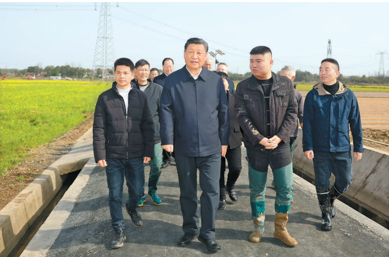
3月18日至21日,中共中央总书记、国家主席、中央军委主席习近平在湖南考察。这是19日下午,习近平在常德市鼎城区谢家铺镇港中坪村,同种粮大户、农技人员、基层干部亲切交流。