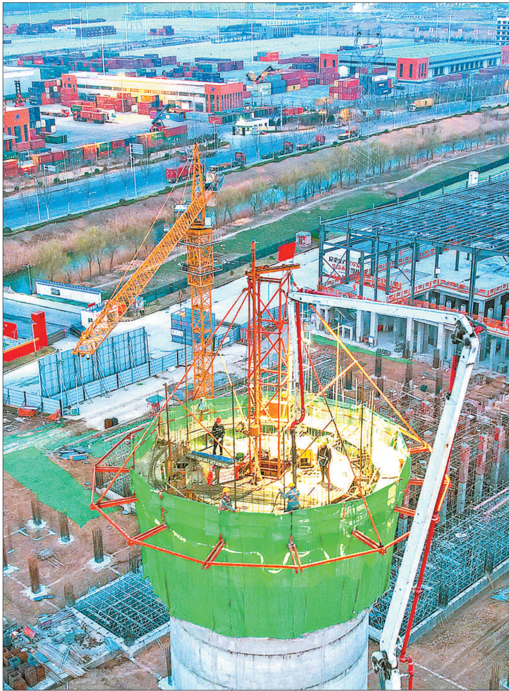
日前,在位于江苏省宿迁市宿城区的凯盛新材料项目施工现场,建设者挑灯夜战,确保项目建设稳步推进。

近年来,宿城区聚焦重点产业培育,确保落地项目尽快开工,开工项目尽快投产,扎实推进新材料、新能源、新一代信息技术、医药健康等产业发展壮大。