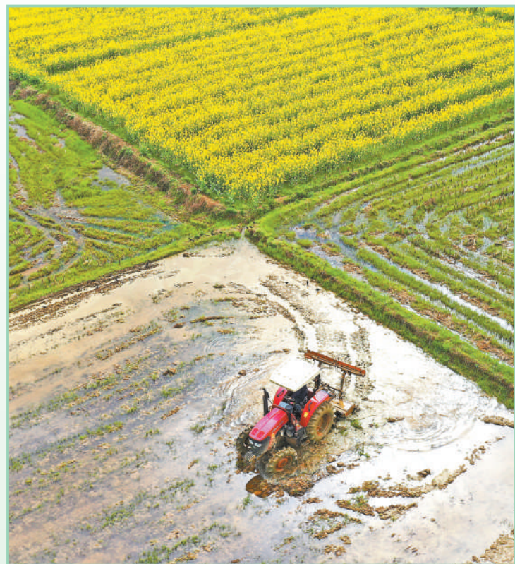
湖南省衡阳市衡东县白莲镇,当地村民驾驶农机在翻耕稻田。