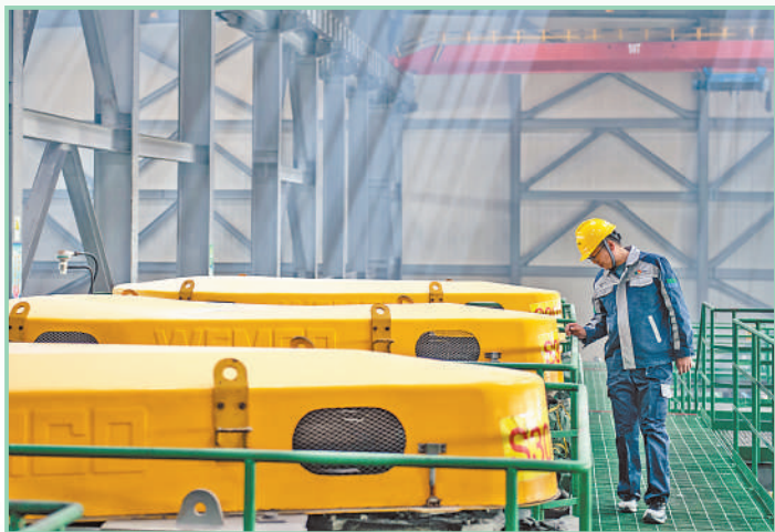
▲青海盐湖工业股份有限公司钾肥分公司加工车间内,工人在巡检钾肥生产状况。