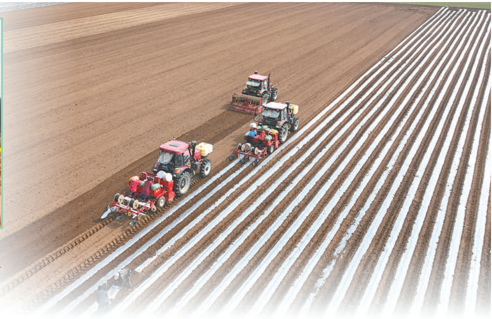
山东省临沂市郯城县马头镇圩西村蔬菜种植基地,农机手驾驶播种机在播种“订单土豆”。