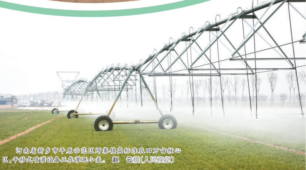
河南省新乡市平原示范区师寨镇高标准农田万亩核心区,平移式喷灌设备正在灌溉小麦。