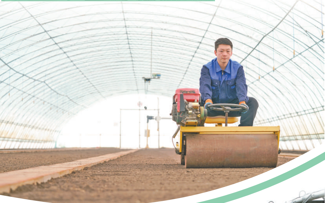
▼黑龙江北大荒农业股份有限公司友谊分公司智慧农场育秧大棚里,职工在进行水稻育秧前的地面平整作业。