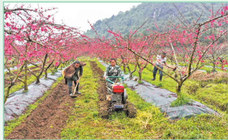
广西壮族自治区桂林市灵川县海洋乡天桃种植基地,村民在桃园间开沟施肥。