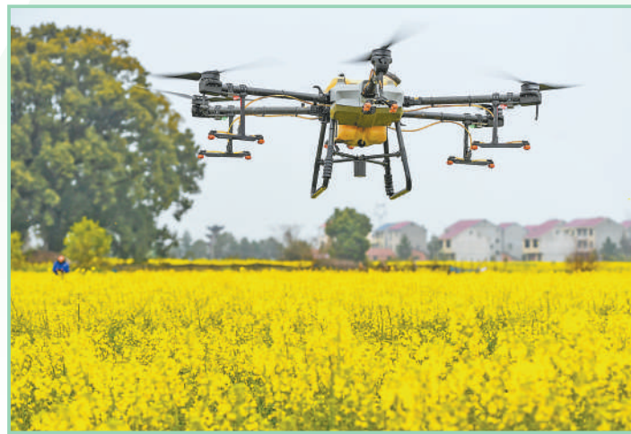
▲江西省樟树市,农民和农业合作社抢抓农时,开展植保无人机“飞防”作业等农事活动。