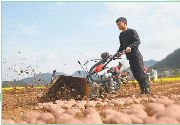
贵州省铜仁市松桃苗族自治县孟溪镇寨阳村,农民在整地培育红薯苗。