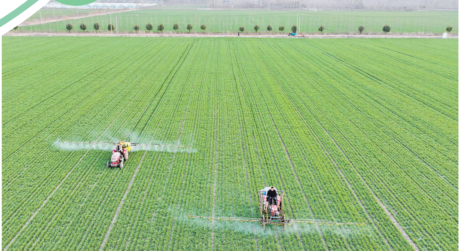
▼安徽省亳州市谯城区双沟镇三官村方向家庭农场,农民驾驶植保无人机对小麦进行喷洒除草作业。