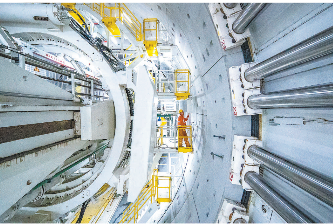
山东青岛胶州湾第二海底隧道工程正在加紧建设,目前盾构机已掘进至海平面下约60米。图为3月18日,中铁十四局的建设者操作“海天号”盾构机进行管片拼装。

导管架总高338.5米,总重达3.7万吨,用钢量接近国家体育场“鸟巢”……3月12日,由我国自主设计建造的深水导管架“海基二号”建造完工,刷新了多项亚洲纪录。