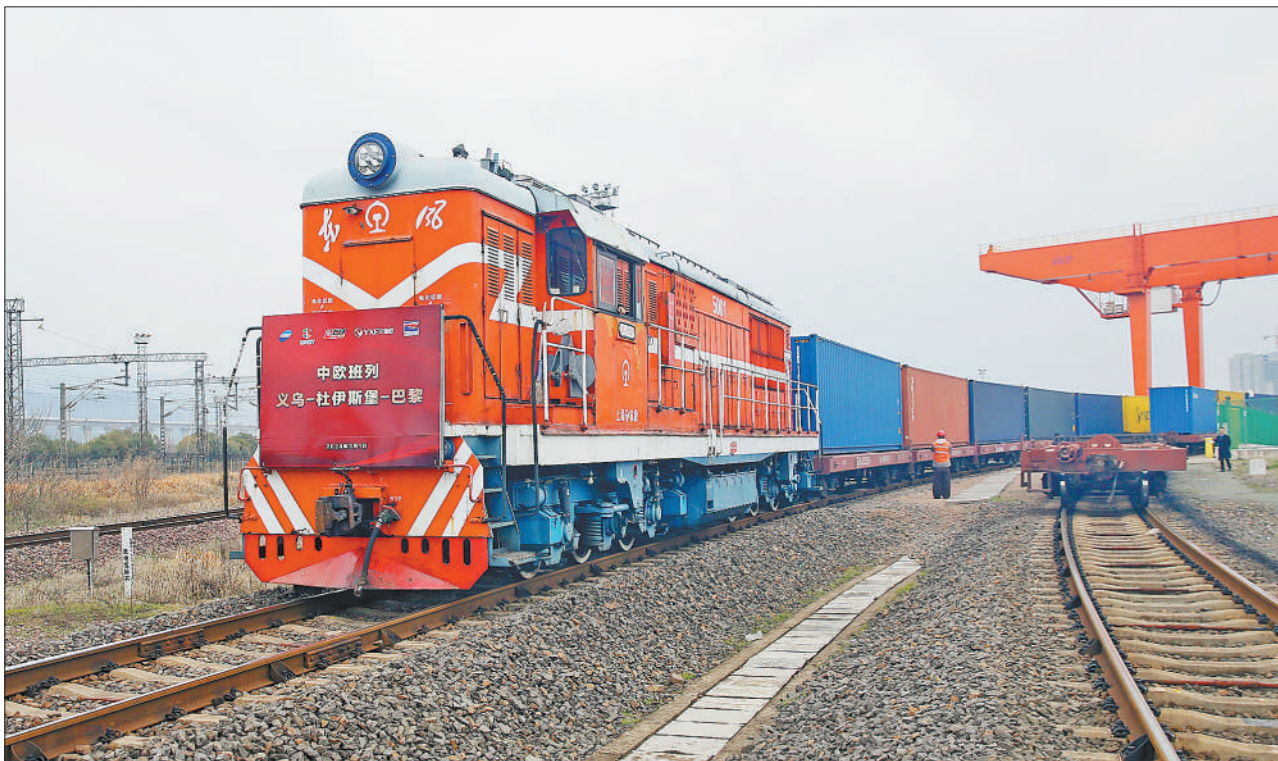
上图：近日，一列装载书画、瓷器等艺术品的中欧班列(义乌—杜伊斯堡—巴黎)从义乌铁路口岸鸣笛启程，驶往法国巴黎。