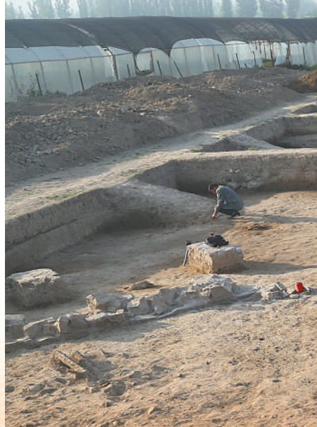
图④:中乌联合考古队在乌兹别克斯坦明铁佩古城外城东墙墓区考古发掘现场。

在费尔干纳盆地20多座古城遗址中,位于盆地南端的明铁佩古城遗址备受瞩目,被称作“丝绸之路活化石”。自2012年起,中乌两国的联合考古队先后对明铁佩古城遗址进行了8次考古发掘。