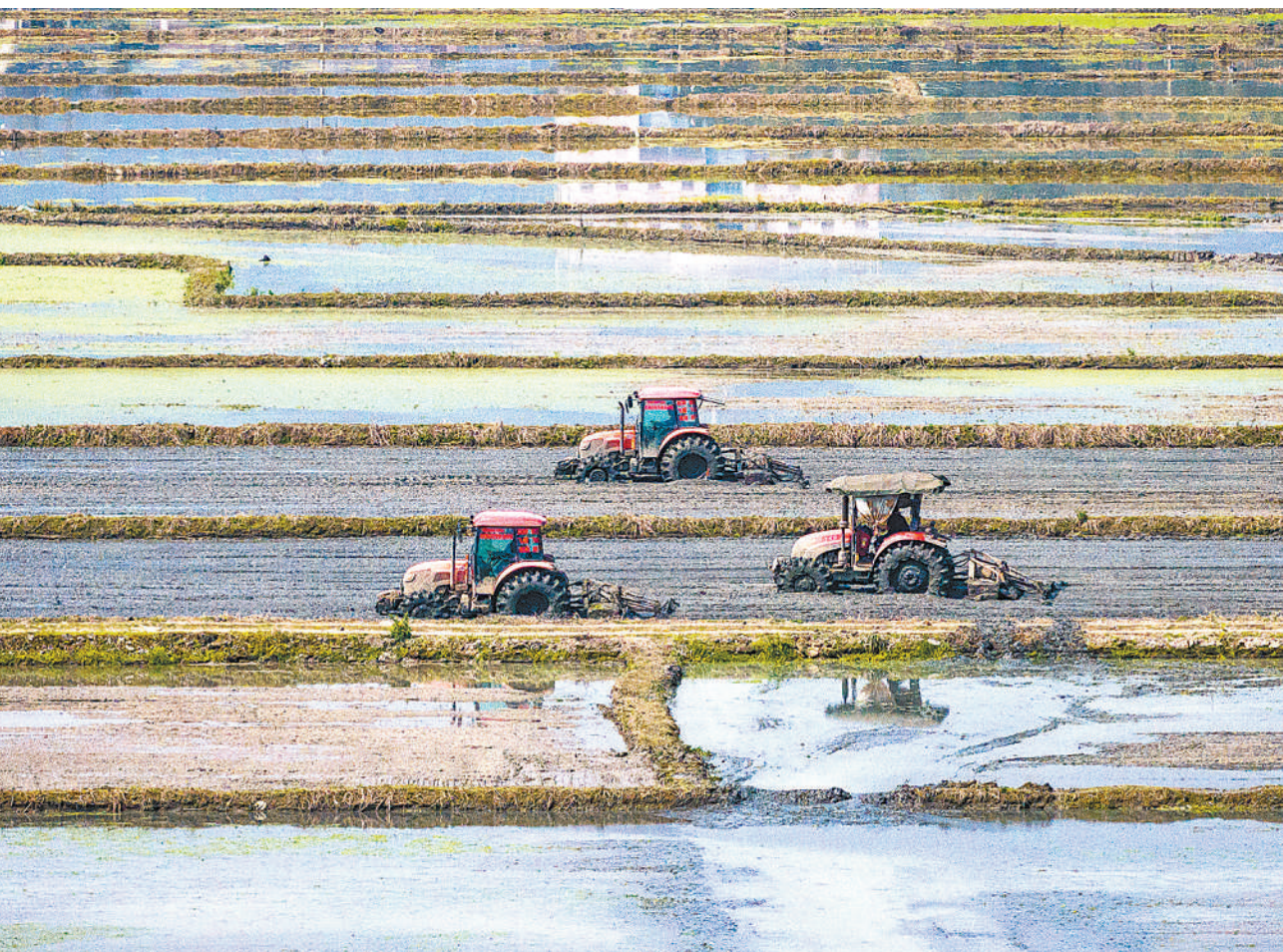
近日,重庆市梁平区屏锦镇天气晴好,当地抢抓农时,运用农机翻耕稻田。