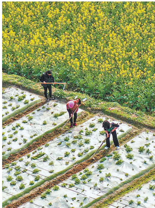
日前,贵州省铜仁市玉屏侗族自治县舞阳村,农民在管护农作物。