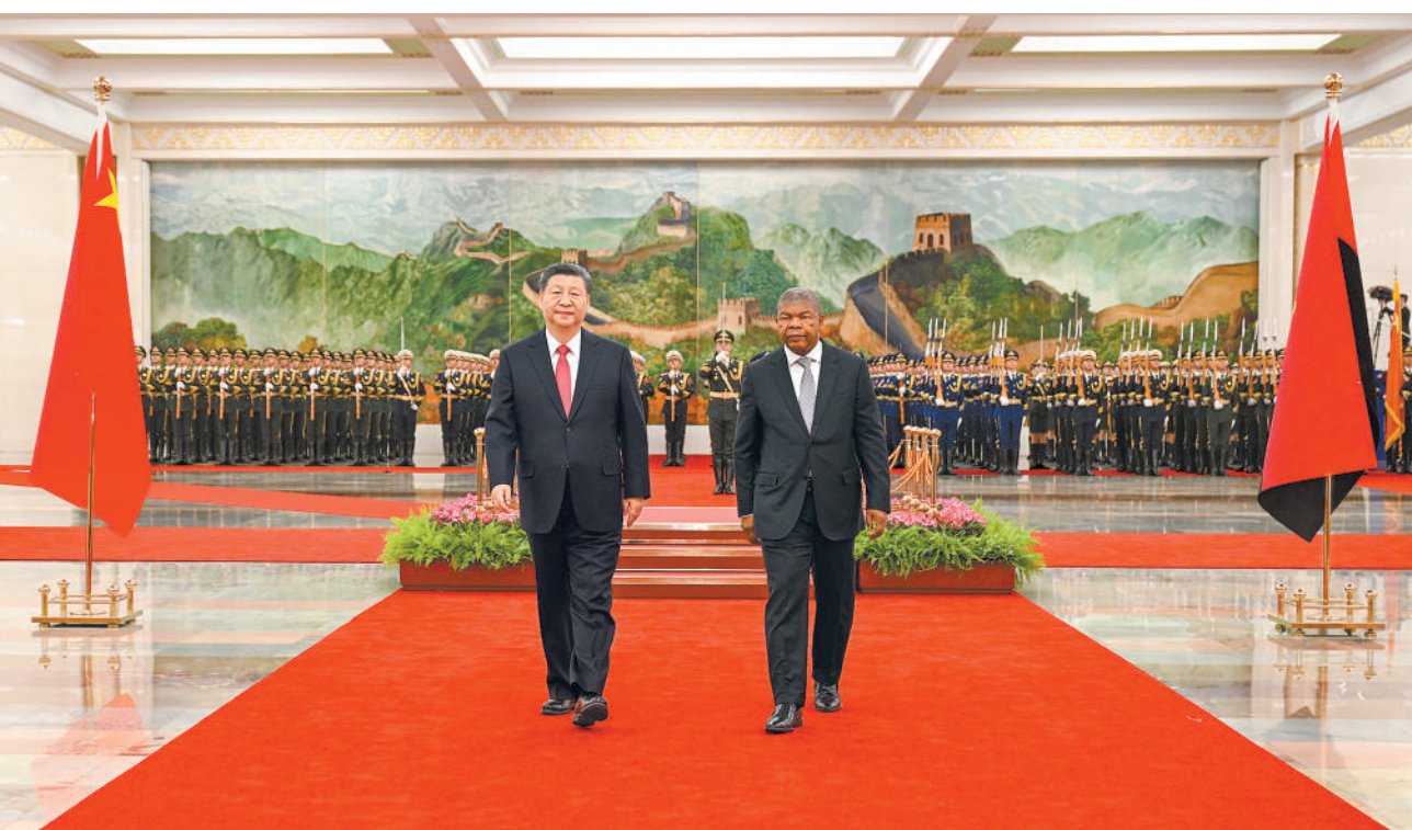
3月15日下午，国家主席习近平在北京人民大会堂同来华进行国事访问的安哥拉总统洛伦索举行会谈。这是会谈前，习近平在人民大会堂北大厅为洛伦索举行欢迎仪式。

新华社北京3月15日电 (记者刘华)3月15日下午，国家主席习近平在人民大会堂同来华进行国事访问的安哥拉总统洛伦索举行会谈。两国元首宣布，将中安关系提升为全面战略合作伙伴关系。 习近平指出，去年，中安两国共同庆祝建交40周年。中安关系历经国际风云变幻考验，实实在在造福了两国人民。中安合作属于南南合作、发展中国家合作，是好朋友之间的相互帮助、互惠互利、合作共赢。面对当前变乱交织的世界，双方要赓续传统友谊，加强团结合作，坚定相互支持，实现共同发展。中方支持安哥拉维护国家主权、安全、发展利益，探索符合本国国情的现代化道路，实现国家发展振兴，愿同安方加强治国理政经验交流，提升双边战略关系水平，携手推进各自国家现代化进程。 习近平强调，中安合作基础好、规模大、互补性强，互利合作有着巨大潜力和光明前景。双方应该加强高质量共建“一带一路”合作，推进发展战略对接，推动务实合作提质增效。中方愿同安方实施好重点基础设施项目，支持有实力的中国企业赴安哥拉开展多种形式合作，助力安方实现农业现代化、工业化、经济多元化。希望安方采取更有力措施，保障