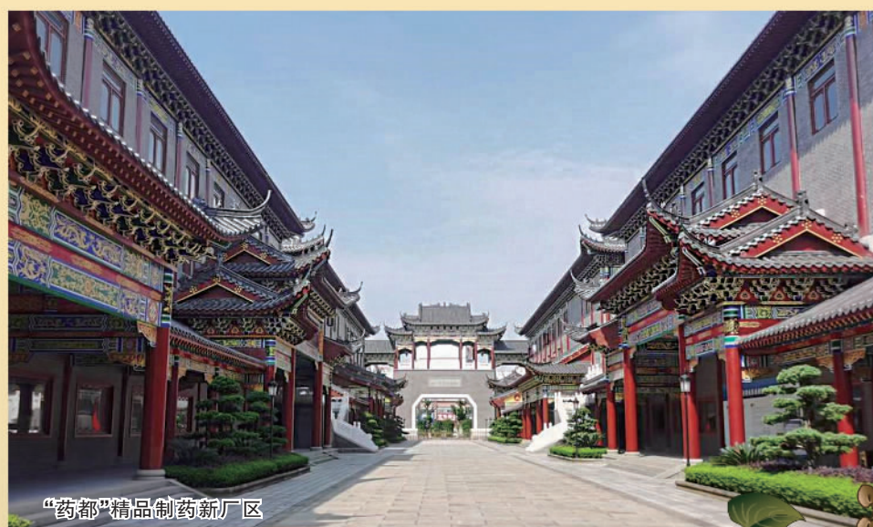
“药都”精品制药新厂区