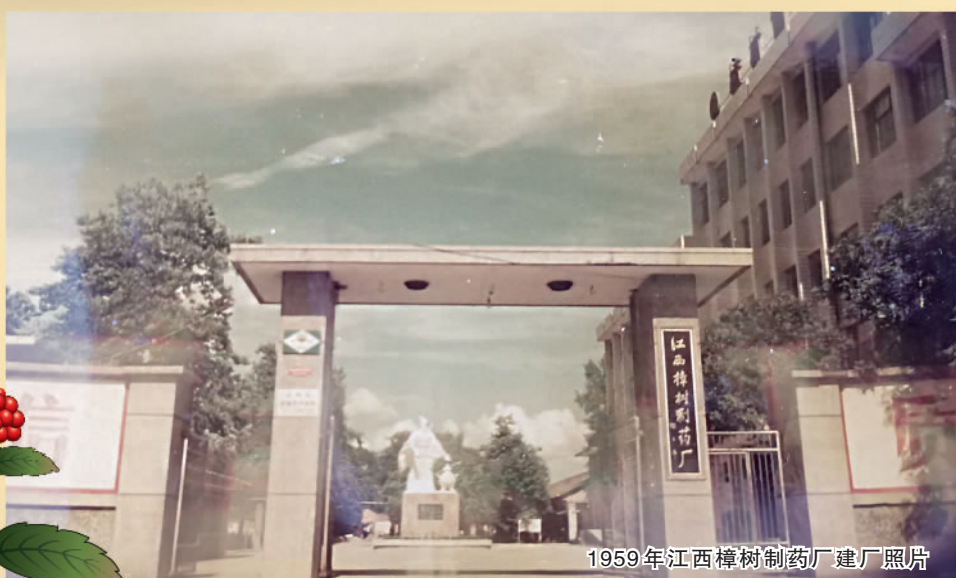
1959年江西樟树制药厂建厂照片