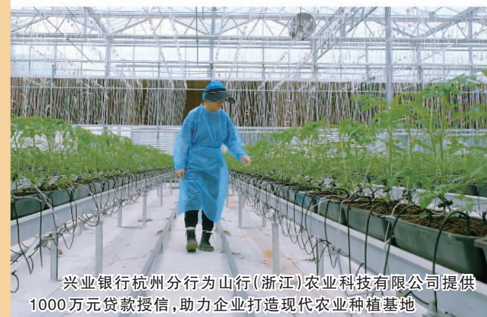
兴业银行杭州分行为山行（浙江）农业科技有限公司提供1000万元贷款授信，助力企业打造现代农业种植基地