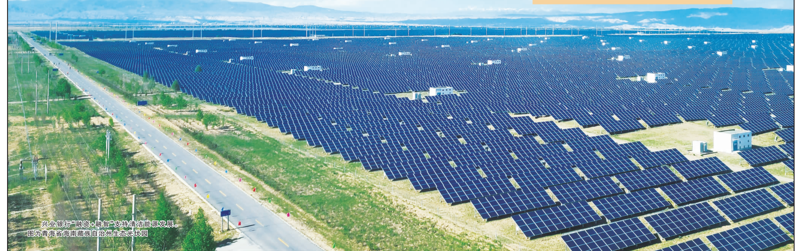
兴业银行“融资+融智”支持清洁能源发展。图为青海省海南藏族自治州生态光伏园