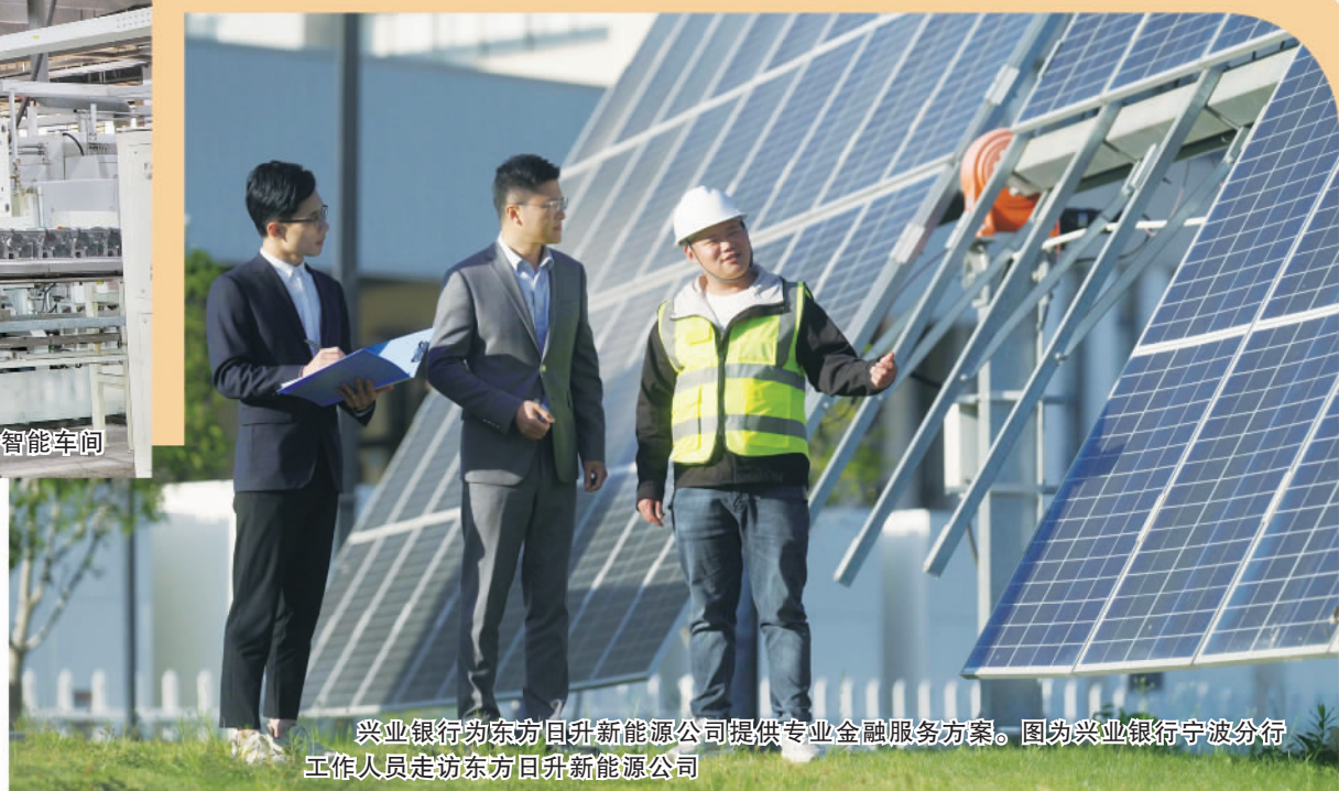
兴业银行为东方日升新能源公司提供专业金融服务方案。图为兴业银行宁波分行工作人员走访东方日升新能源公司